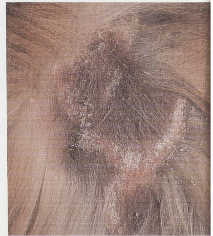
Oberflächliche Pyodermie/Pyodermie superficielle Etiderm