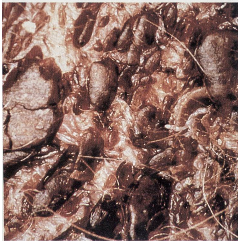
Seborrhoe/Séborrhée Sebocalm / Sebolytic / Sebomild

Virbac: votre partenaire pour les problèmes dermatologiques