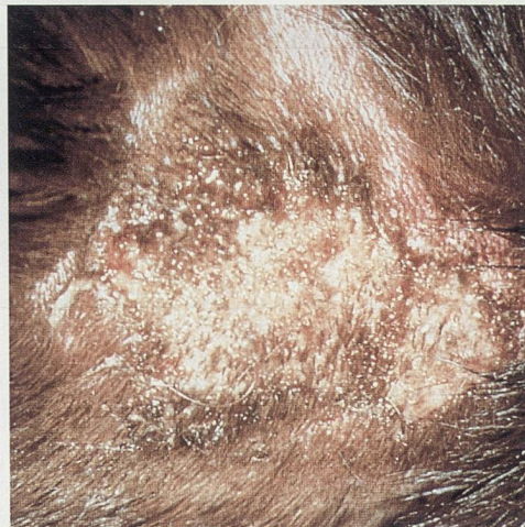
Hot spot/Hot spot Dermacool / Pyoderm

Die synergistische Verbindung einer spezifischen Mikro-Verkapselungstechnik (Spherulites®) mit einem multiaktiven Inhaltsstoff (Chitosanid)