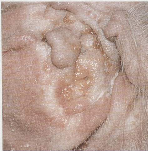
Chronische Otitis/Otite chronique Epi-Otic