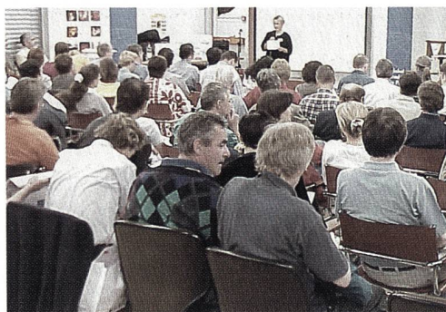
Die interessierten TeilnehmerInnen im Provot-Seminarraum