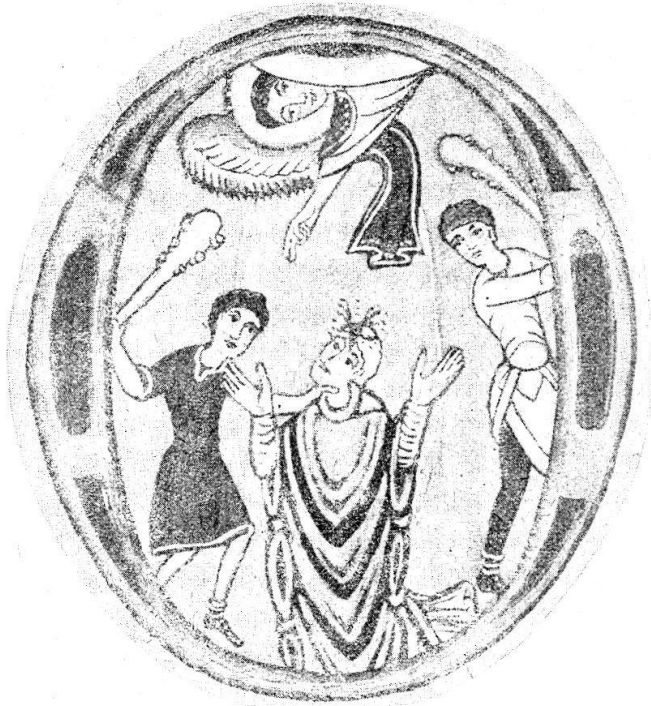
Initiale O aus der Einsiedler Handschrift 111 mit der ältesten Darstellung des Märtyrertodes des hl. Meinrad.