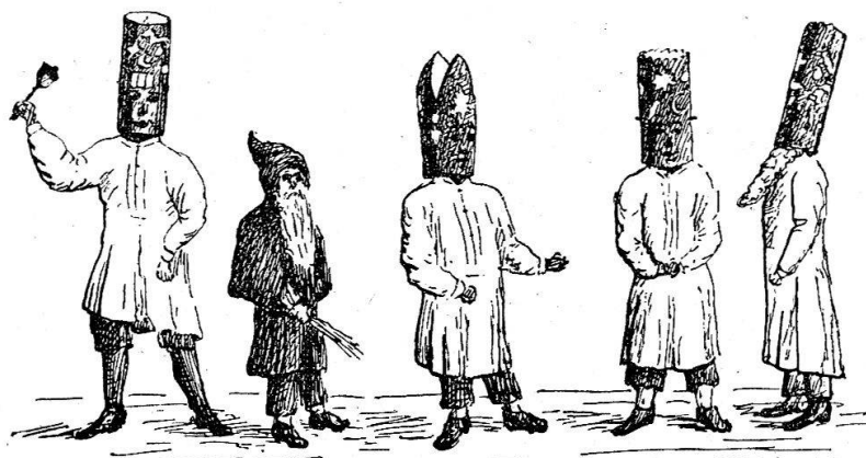
Illustr. 2: Typen von „Samichlausen“ in Glarus.

Nach der Natur gezeichnet von Dr. Ernst Buss.