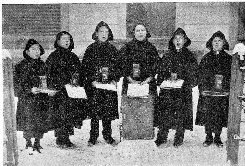
Bremgarter Choralisten als Weihnachtssinger.

Speziell in Boswil sang man ehemals 1) folgendes Weihnachtsgesang :