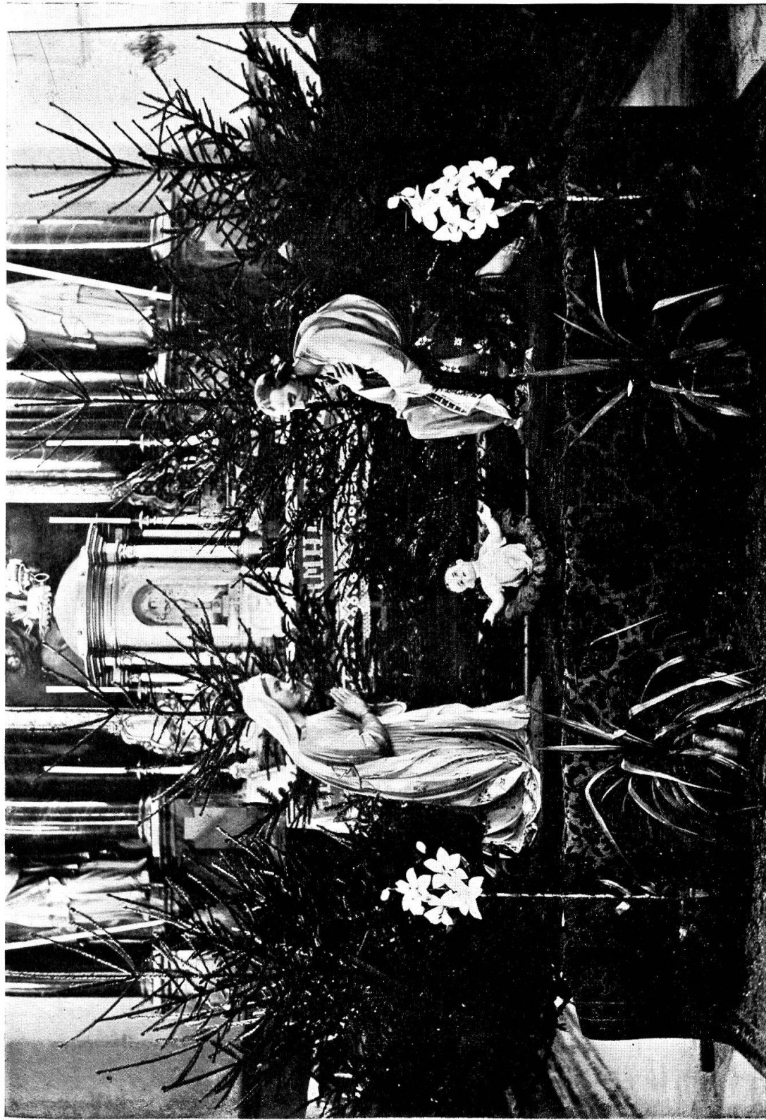
Krippe in Jonen.