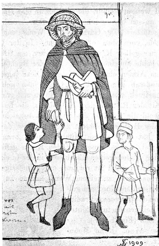
Fig. 8. Fresko in Carona 1486.

In Semione Fresko. Blondlockiger, bartloser Jüngling, in grauem wollenem Hut mit herabfallender Krämpe. Brauner