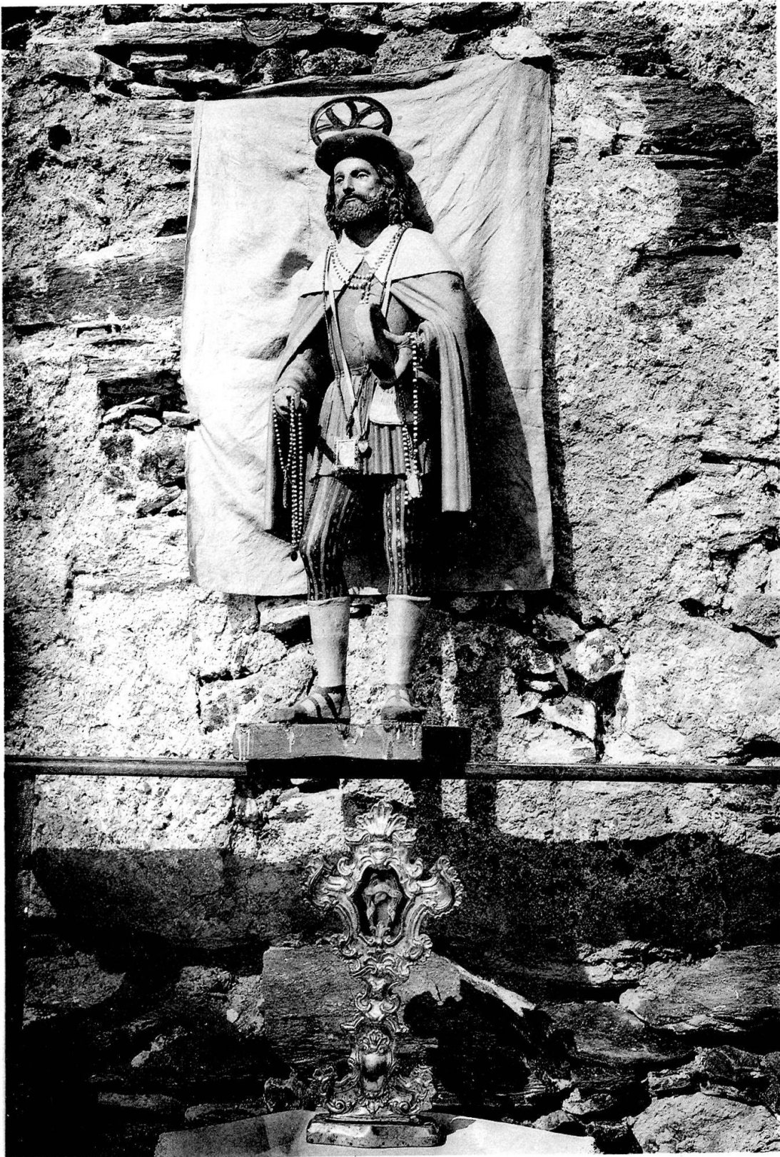
Taf. I. Statue und Reliquiar des h. Lucio. Auf dem S. Lucio-Pass.