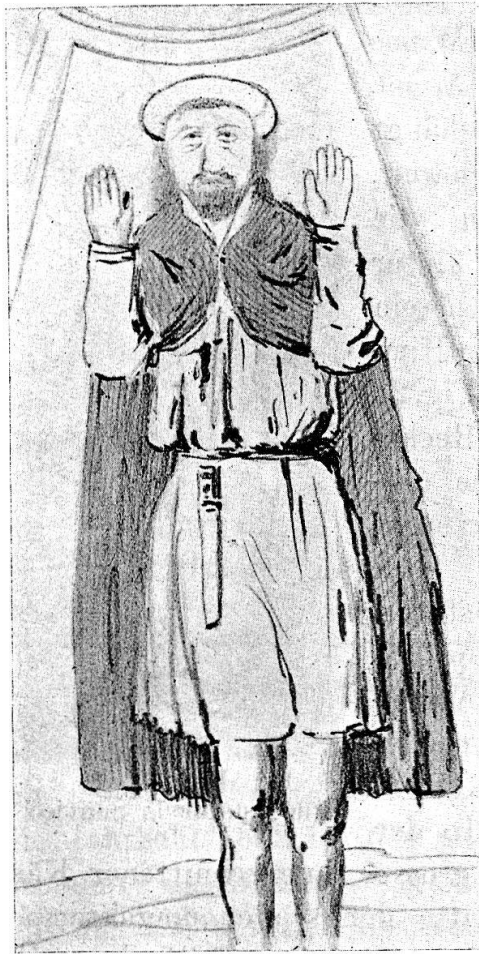
Fig. 10. Gewölbemalerei in San Lucio.

In San Lucio 1. Fresken. In den vier Kappen des ersten Gewölbes der Luciokirche. Zweimal Lucio mit den Armen, zweimal der Heilige im Gebet. Schlecht erhalten. Die Figuren der vier Kappen schauen gegen die Mitte. In der vordersten Kappe S. Lucio stehend, mit zum Gebet erhobenen Handflächen, bärtig, in gelbem, verkürztem Heiligenschein. Gelbes Ärmelgewand, braune Pelerine, nackte Unterschenkel, Füße zerstört. An der Brust rechts senkrechte Wunde, am Gürtel das Messer in der Scheide (Fig. 10).