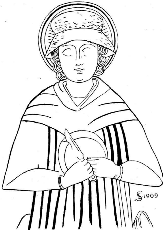
Fig. 4. Fresko in Semione. Mit ausgekratzten Augen.

Das Wasser des Teichs, in den der Heilige geworfen worden sein soll, galt als heilkräftig ( medicis rubescit aquis , Bosca p. 190 nach Brautius). Unter den Deckengemälden auf San Lucio scheint eine Szene die Heilung von Blinden darzustellen. Die Fresken datieren vom Beginn des XVI. Jahrhunderts. Früher wuschen sich die augenleidenden Pilger am Teich die Augen; wer nicht hinauf wallfahren konnte, liess sich Wasser aus dem Teich bringen. Jetzt ist derselbe trocken und ein auf der Ostseite angebrachter Ausbruch verhindert ferneres Ansammeln von Wasser. Das Gemälde von Tavordo