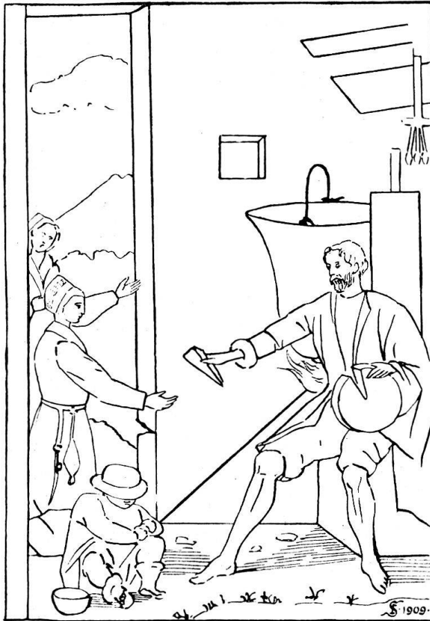
Fig. 12. Wandgemälde in Medeglia 1687.

braunbärtig, mit schlichtem Haar; er reicht mit der Rechten einen Käsebissen, mit der Linken hält er den angeschnittenen