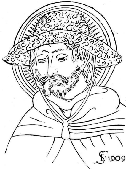
Fig. 1. Fresko in Carona.