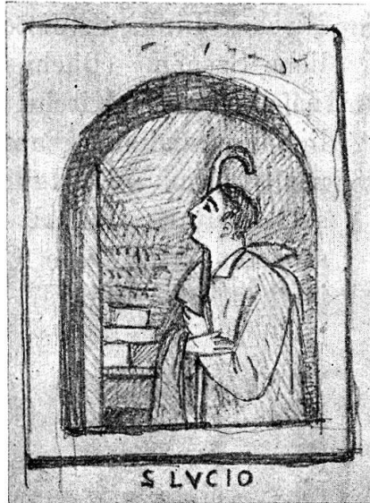
Fig. 6. Wandgemälde in Lamone.

Lodi. Die Vornamen Uguçon, Ugozonus, Ugonzonus, Ugentionus kommen in Urkunden des XII. und XIII. Jahrhunderts vor. Die Verehrung S. Uguzos bezeugt Ferrario 1613 im Index seines