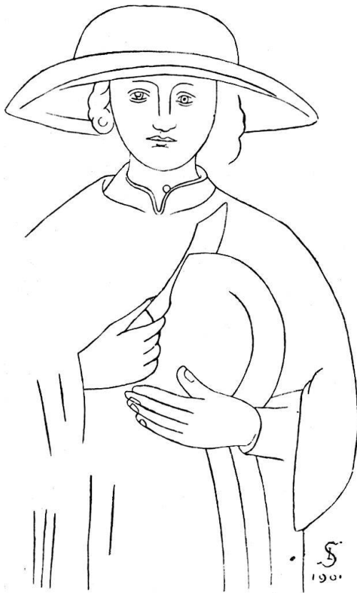
Fig. 3. Fresko in Verscio.

Käser. Aus den sämtlichen, sehr zahlreichen Darstellungen, welche als stehendes Attribut und Kennzeichen des