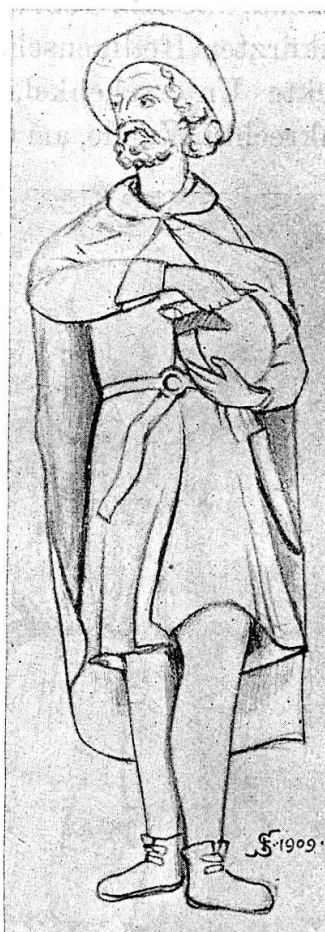
Fig. 11. Stuccostatue in Sonvico.

In Medeglia Fresko im Chor der Pfarrkirche. S. Lucio sitzend in einer Alphütte. Hemd, faltige lange Jacke, weite Kniehosen, nackte Unterschenkel und Füsse. Der Heilige ist