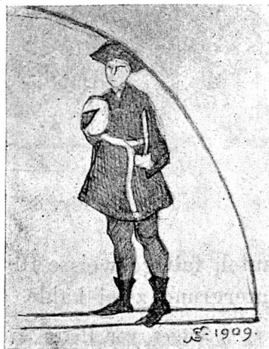
Fig. 9. Fresko in Dasio 1516.

In Dasio Fresko 1516. Der Heilige in breitkrempigem Hut, in Ärmelrock, mit Gürtel, der vorn lang herabhängt. Enganliegende Hosen und hohe Lederschuhe. In der R. der angeschnittene Käse, in der L. das Messer. Inschrift: S. Luguzon 1516 .