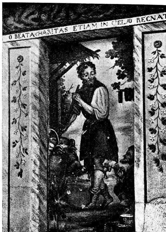
Fig. 7. Wandgemälde in Peccia.

Puria. In der Pfarrkirche befindet sich links ein barocker Altar der hh. Bernard, Anton und Lucius. Rechts vom Beschauer steht die lebensgrosse Stuccostatue des Heili-