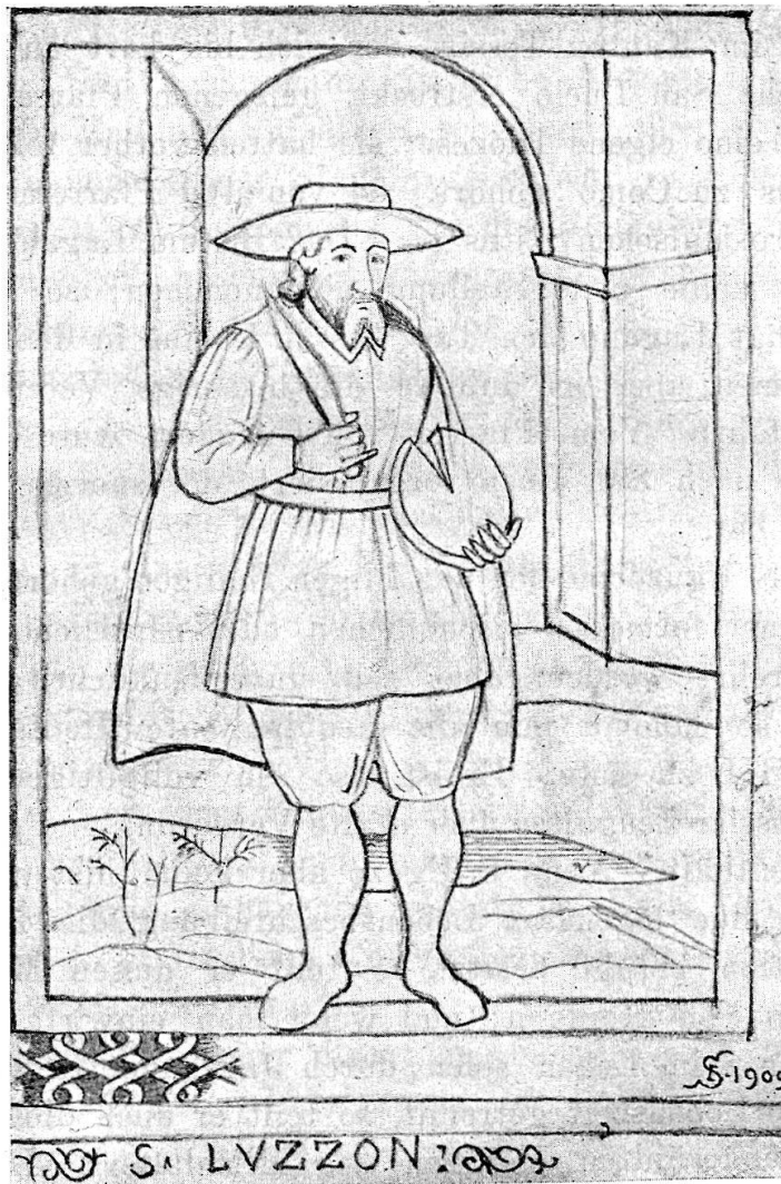
Fig. 2. S. Uguzo und der rote Teich.

Für das Martyrium des Heiligen liegen keine sehr alten Zeugnisse vor; im Gegenteil geben die Gemälde des Mittelalters dem Heiligen weder diesen Titel, in den Beischriften, noch die Wunde. Und auch das Messer in der Hand ist nicht als Marterinstrument, sondern als Hausgerät charakterisiert; ob