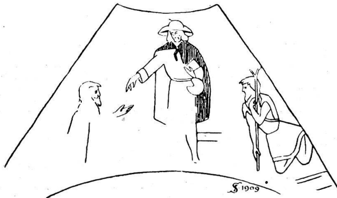
Fig. 5. S. Uguzo zwischen Blinden (?) und Lahmen. Gewölbemalerei in San Lucio. XVI. Jahrhundert.

Lahme. Ein Freskobilde in der Luciokirche zeigt einen Lahmen mit einer Krücke vor dem Heiligen (vgl. Fig. 5 rechts); auch auf dem Bilde von Manzoni in der Bernardinskirche zu Mailand bewegt sich ein Armer an der Krücke zu