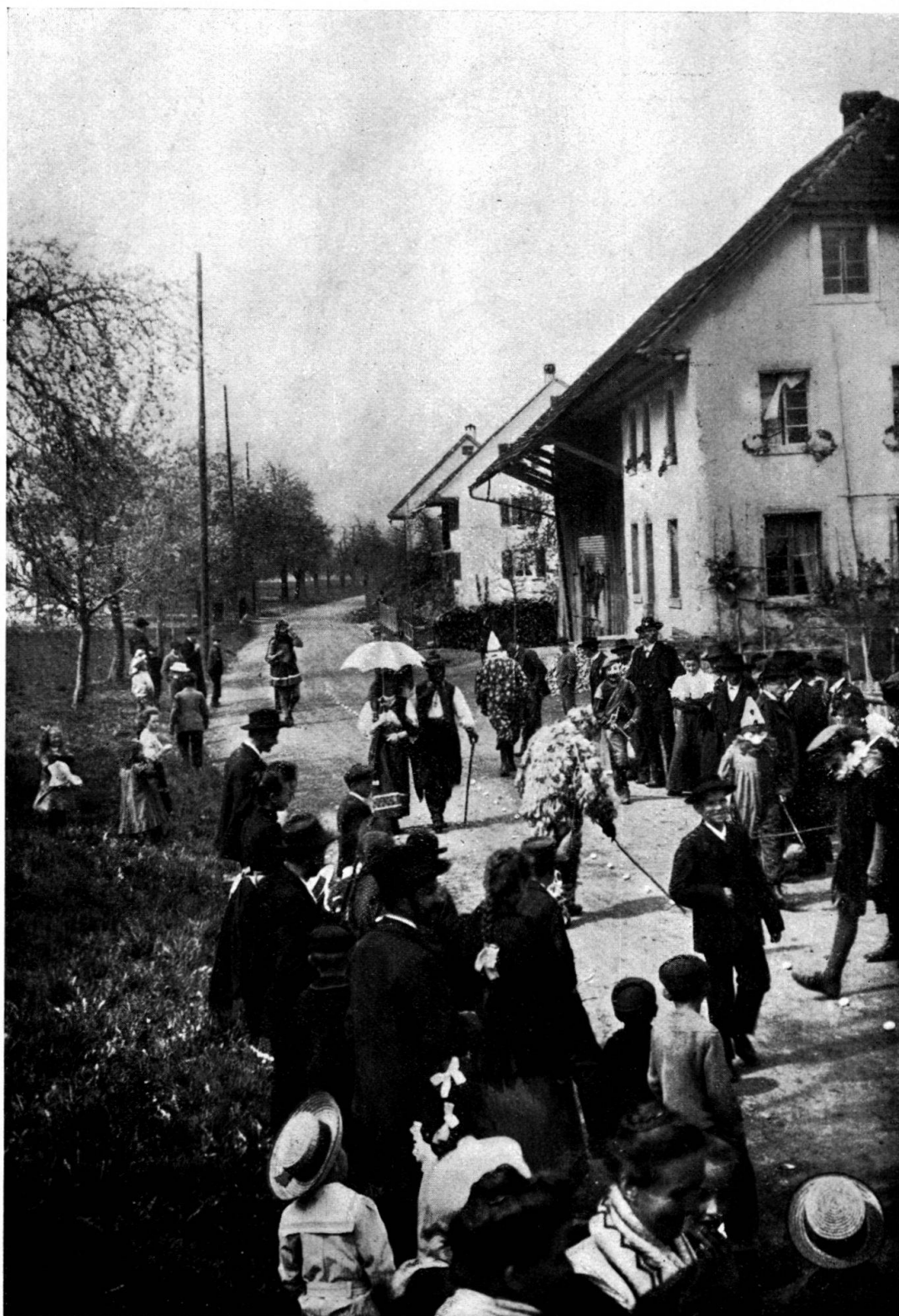
Eierauflesen in Dintikon.

Der „Güggel“, die gelegten Eier zählend, und andere „Böhli“.