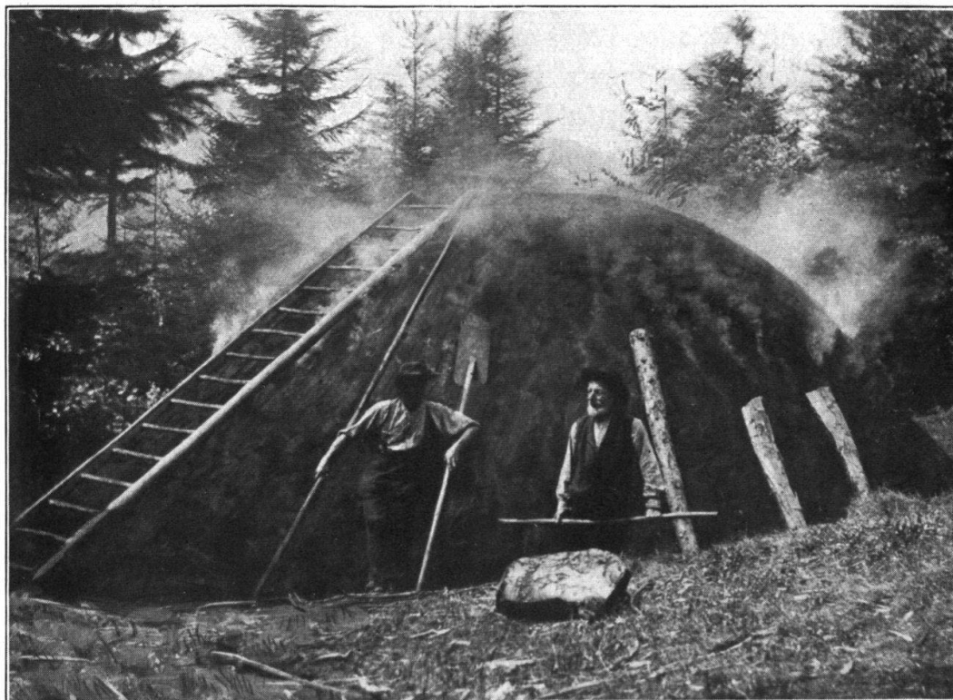
Fig. 2. Brennender Kohlenmeiler.