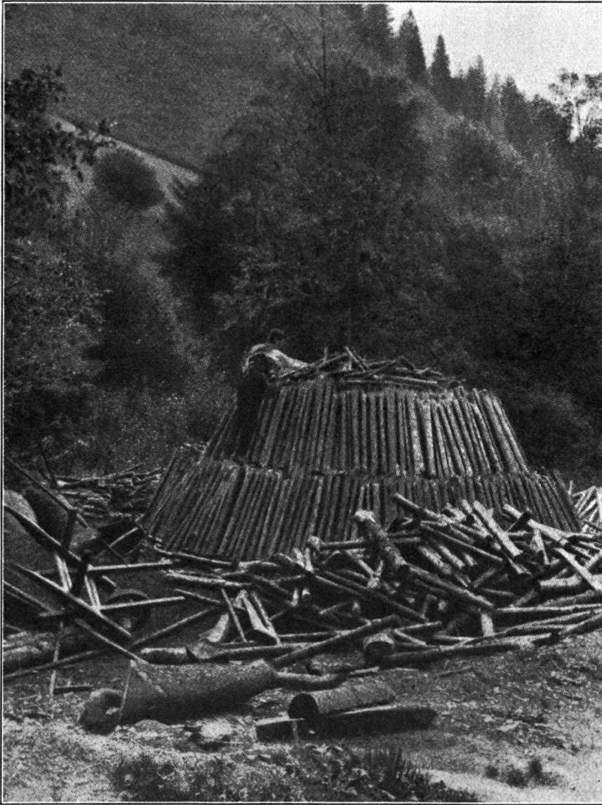
Fig. 1. Bau eines Kohlenmeilers.