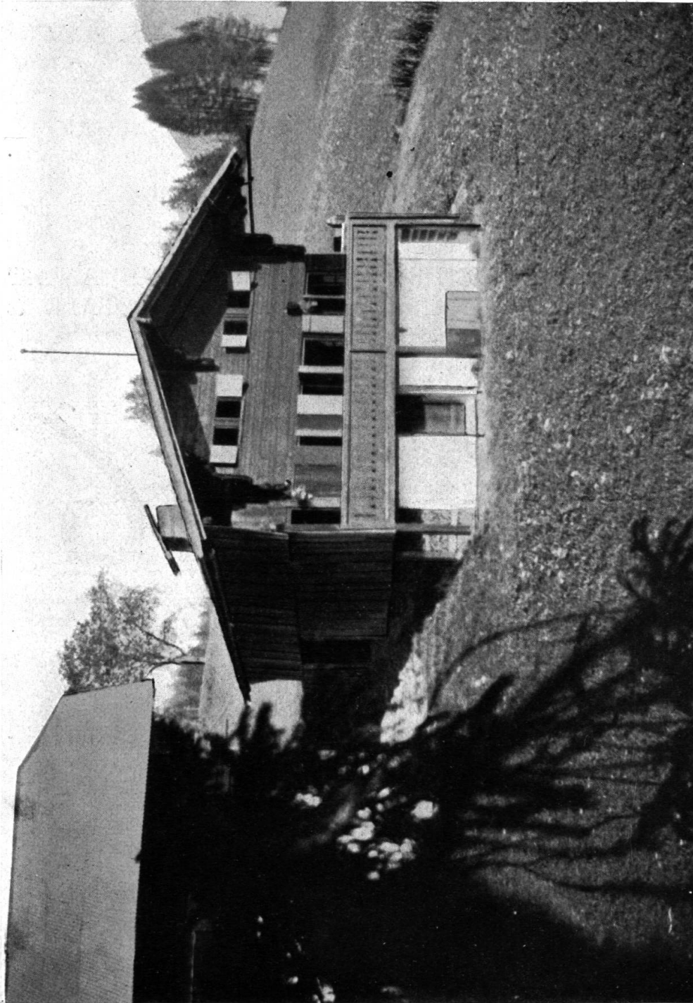
Fig. 33. Au Chabloz s. Les Moulins. 1696. (Maison ne portant aucune indication autre, qu'une date intéressante; voir fig. 32, page 172.)