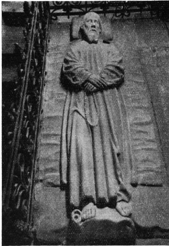
Grabplatte von 1518 im Beinhaus Sachseln. Über der linken Schulter ist die viereckige Öffnung sichtbar.

ein Zugang, der tagsüber offengelassen wurde, damit die Pilger das Grabmal mit dem Körper berühren, corpore sepulchrum contingere , und die Statue küssen konnten 1 . So wird das Grabmal schon auf dem um 1520 gemalten Freskenzyklus in der untern Ranftkapelle dargestellt 2 .