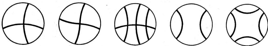
1. Enneberg 2. Jenesien 3. Kurtatsch-Graun 4. Kurtatsch-Graun 5. Antholz