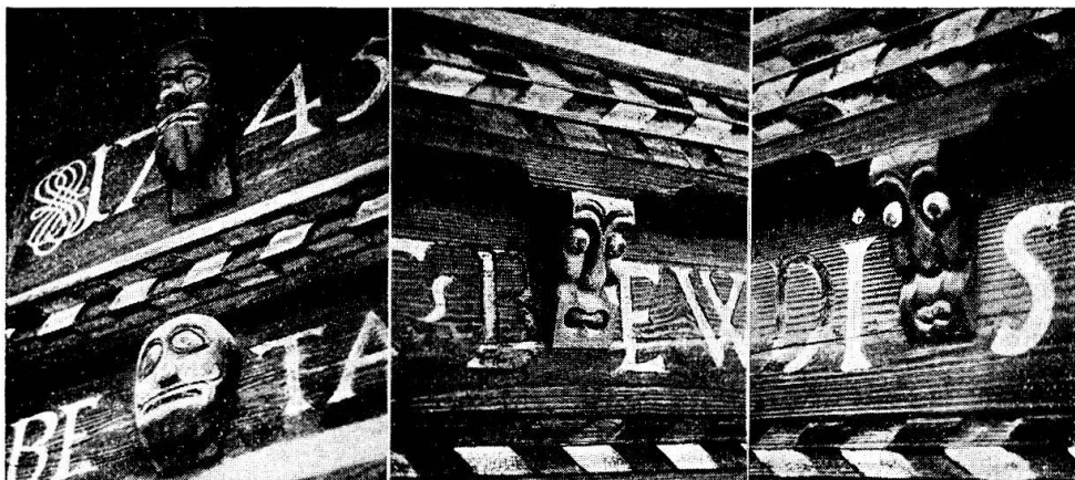
Konsolenfratzen an einem Haus in Matten bei Interlaken.

So erschien 1941 im Urs Graf-Verlag, Basel, ein Prachtwerk über «Schweizer Bauernkunst». Hier wird auf Tafel 5 eine menschliche Fratze gezeigt, welche mit der Legende versehen ist: «Dämonenkopf als Stallschutz gegen Unheil, Habkern b. Interlaken, 1738». Das Stück soll sich im Besitze eines Neuenburger Sammlers befinden, ist somit aus seiner ursprünglichen Umgebung herausgerissen und den Herausgebern des Werkes durch die Basler Volkskunstaussstellung zu Gesicht gekommen. Wenn sie sich die Mühe genommen hätten, in Interlaken und Umgebung nach ähnlichen Fratzen zu suchen, so hätten sie solche recht zahlreich als schmückende Konsolen an den Fronten verschiedener Häuser in Unterseen, Matten, Bönigen, Gündlischwand, Grindelwald und Habkern gefunden. Aber lediglich an solchen Häusern, die in den Jahren 1730 bis etwa 1780 erstellt worden sind. Kein Zweifel, irgend ein künstlerisch begabter Zimmermann entwickelte diese Gebilde aus der architektonisch bedingten Konsolenform heraus und andere ahmten ihn eine Zeitlang nach. Die fragliche Fratze hat also weder mit Dämonen noch mit dem Stall, dessen Architektur sie ja auch nicht entspricht, etwas zu tun.