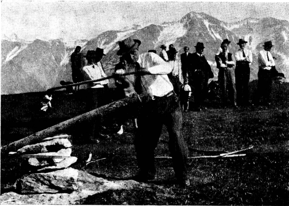
Abb. 1. – Der Schläger am Bock (Betten 1953).

das nach einem Unterbruch von fast zehn Jahren wieder zu Ehren gezogen wurde 1 .