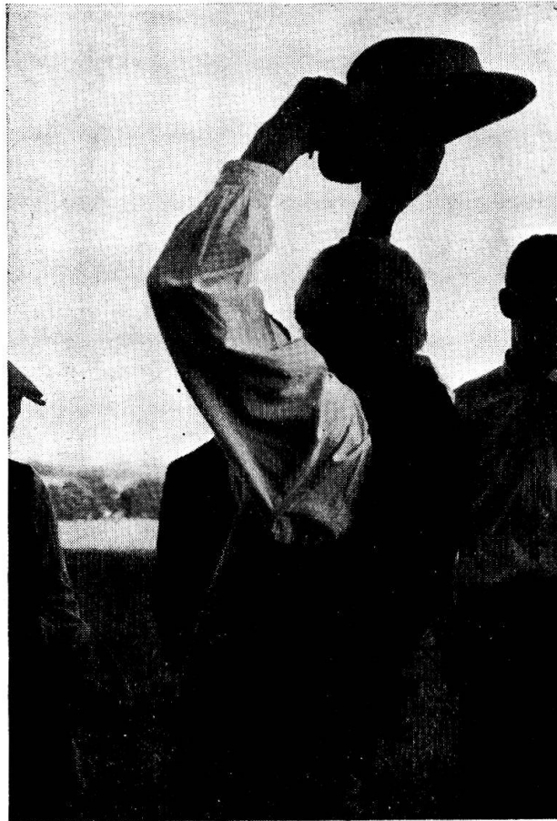
Abb. 5. Beim Loswerfen (Huttwil 1954).

womit Gewähr geleistet ist, dass niemand die Entscheidung des Loses nachträglich umgehen kann.