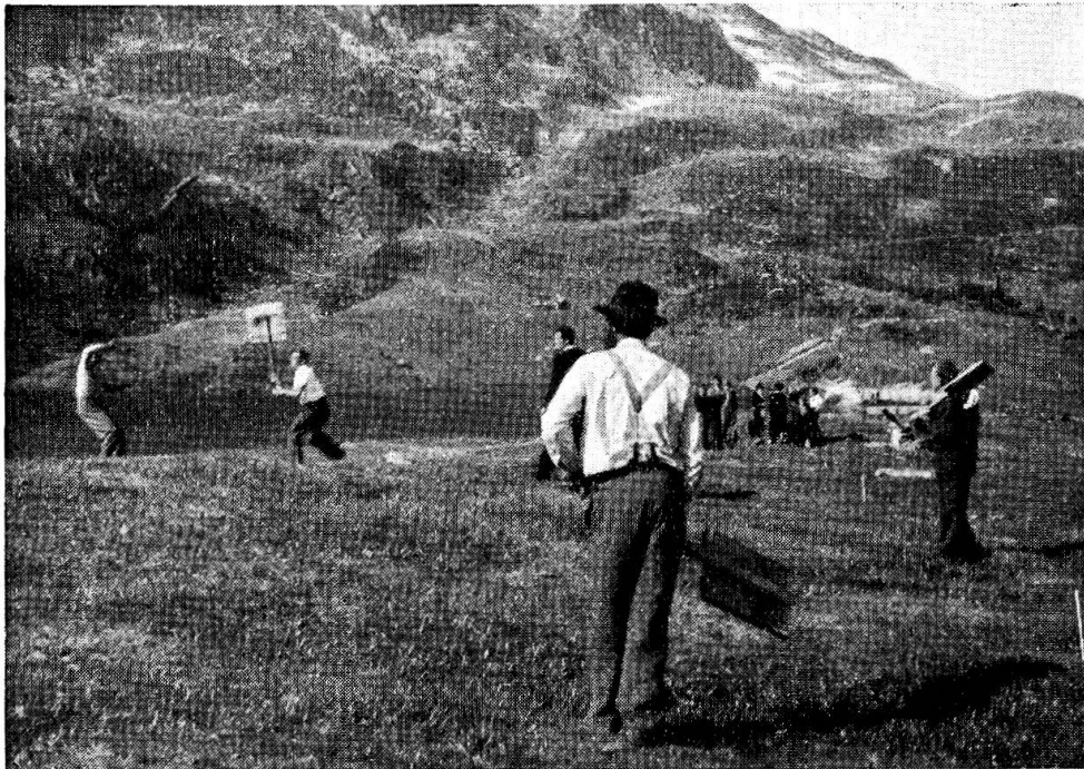
Abb. 2. – Die Gegenpartei beim Abfangen des Wurfkörpers (Betten 1953).

Spieler abwechslungsweise aus den Teilnehmern ihre Mitspieler auswählen. Um den ersten, der wählen darf, zu bestimmen, hält man eine Schindel vor sich hin, bezeichnet die eine Seite mit einem Kreidestrich, mit einer eingeritzten Kerbe oder auch nur indem man darauf spuckt. Hierauf wirft man die Schindel in die Höhe, so dass sie sich dreht. Diejenige Seite, die nach oben zu liegen kommt, entscheidet. Auf ganz gleiche Weise bestimmt man die Partei, die als erste mit dem Schlagen beginnen kann. Doch zuerst muss das Spielfeld ( griss ) abgesteckt werden. Die Schläger richten den Bock ( šuslatte ) her, der aus einem dünnern Tannenstämmchen besteht, das auf der einen Seite mit Steinen unterlegt wird (Abb. 1), so dass es schräg aufwärts in die Luft schaut. Das untere Ende wird leicht in die Erde eingegraben und mit weitem Steinen beschwert, damit der Bock ganz ruhig liegt. Auf der aufragenden, oberen Seite wird die Oberfläche mit einem Beil glatt gehauen, so dass der Wurfkörper ( beinkue ) gut aufliegt (Abb. 3). Als Wurfkörper dient der sich im Hufeiner Kuh befindende Knochen, also der äusserste Zehenknochen. Aus Erlenästen oder Haselstauden werden einige Stöcke in der Länge von zwei bis drei Metern geschnitten.