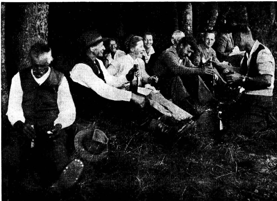
Abb. 6. – Vesperimbiss am Waldrand (Huttwil 1954).

wonnene Riese hat. Für jedes verlorene Spiel hat jeder Spieler einen «Batzen» zu bezahlen, womit die Kasse der Gesellschaft gefüllt wird. Nach der Abrechnung werden die Spieler neu verteilt nach der gleichen früher beschriebenen Art. Dann geht das Spiel wieder weiter, bis die Gesellschaft am althergebrachten Platze ankommt, wo man einen Imbiss einnimmt. Hier hatte ein dazu bestimmter Spieler ein kleines Depot von Tranksame versteckt, die nun hervorgeholt wird. Aus der Tasche zieht ein jeder ein mitgebrachtes Brot und fröhlich plaudernd setzt man sich am Waldrand nieder und genießt die Pause. Nach diesem Unterbruch wird das Spiel wieder aufgenommen bis der Ausgangspunkt wieder erreicht ist. Hier hat man ca. 8 km zurückgelegt und es ist unterdessen Abend geworden. Die Spieler nehmen Abschied voneinander und die Bauernsöhne unter ihnen kehren rasch zu ihrer Arbeit in Stall und Scheune zurück.