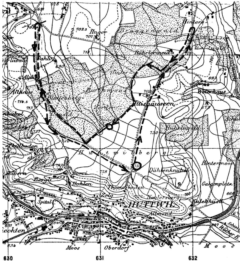
Strecke, auf der sich jeden Sonntag das Spiel abwickelt (Masstab 1 : 25 000).

Null taxiert. Auf der Bahn, die zum dröolen bestimmt ist, werden nach diesem ungültigem Raum, der täschenlatte , auf je zwei Meter Nummern aufgestellt, ähnlich wie dies beim Hornussen auch der Fall ist. Auf der andern Bahn stehen die Nummern nur 1 Meter auseinander; dabei gilt der Punkt, wo die Kugel zum ersten Male den Boden berührt, für die Bewertung des Wurfes. Jeder Spieler muss an beiden Bahnen antreten und hat drei Würfe zur Verfügung. Er hat hingegen die Möglichkeit, eine schlechte Passe durch Nachdoppeln zu ersetzen (eine Gewohnheit, die aus dem Schiessbetrieb stammt). Es gelten aber stets nur drei nacheinander geworfene Kugeln. Am Schlusse werden von beiden Parteien die Resultate zusammengezählt, wobei man die Ergebnisse der schlechtern Spieler ausscheiden kann (wieder eine Gewohnheit des Sektions-