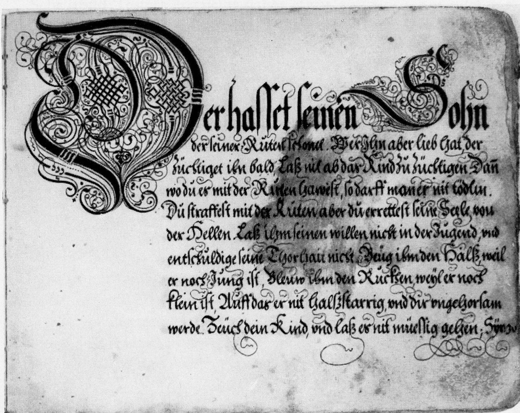
Abb. 4, Vater Tester, Zeichnung, 1694