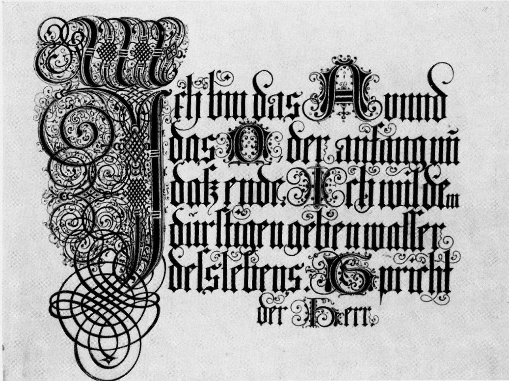
Abb. 7, Heinrich Ulrich, Stich, 1604