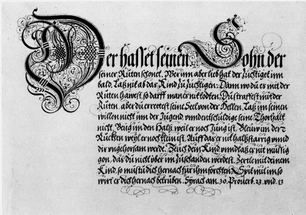
Abb. 3, Heinrich Ulrich, Stich, 1604