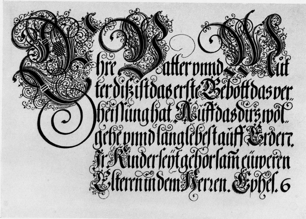
Abb. 5, Heinrich Ulrich, Stich, 1604