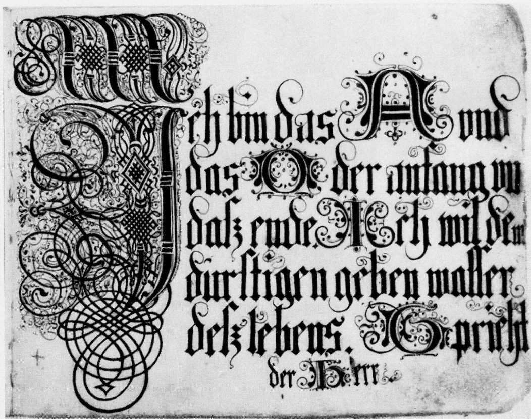
Abb. 8, Vater Tester, Zeichnung, 1694