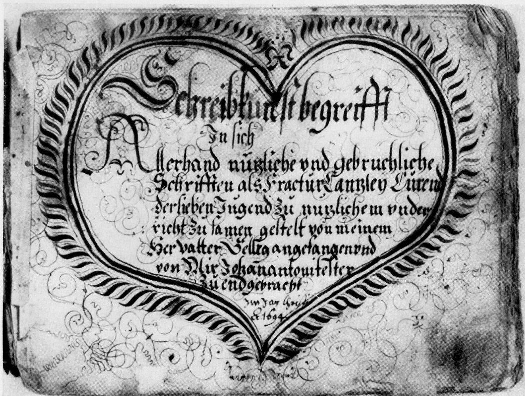
Abb. 2, Tester, Zeichnung, 1694