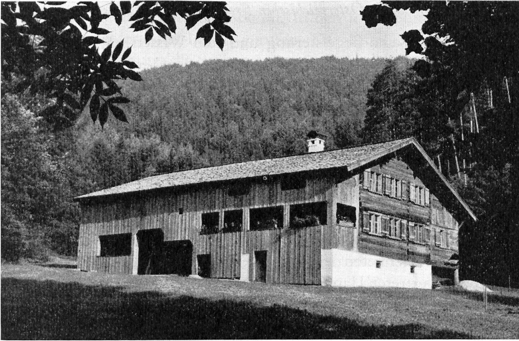
Abb. 3. Bregenzerwalderhaus aus Schwarzenberg i. Vorarlberg.