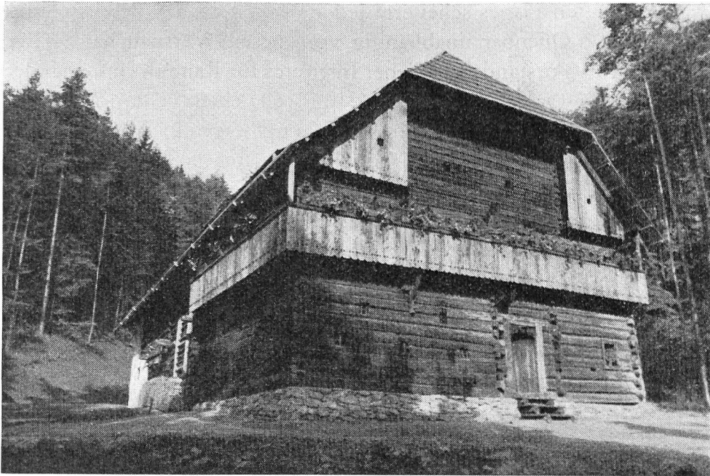
Abb. 1. Rauchstubenhaus vulgo « Säuerling » aus Einach an der Mur.