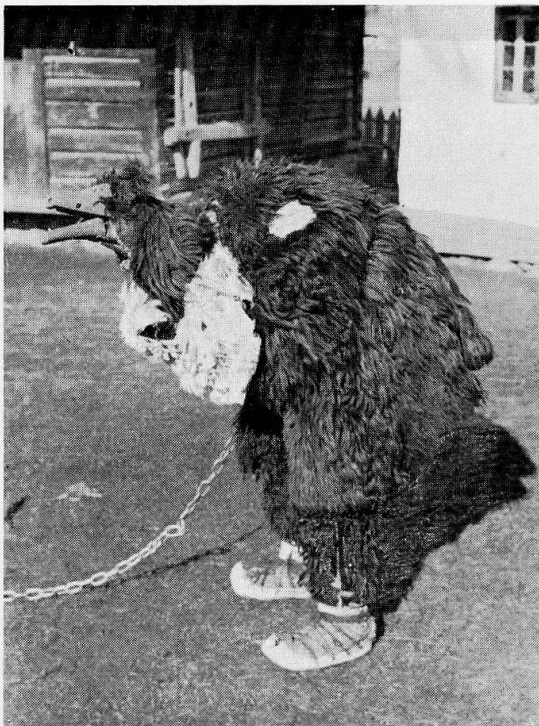
3 Bärenmaske aus dem Gebiet von Suceava, gebraucht an Neujahr.