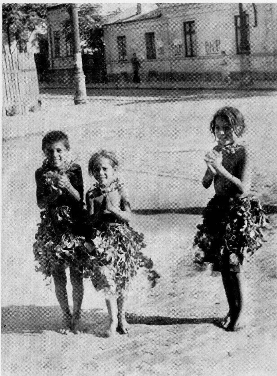
5 «paparude», Regenmädchen, aus Muntenien.