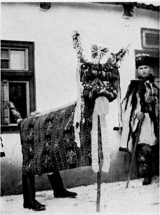
4 «turca» aus dem Gebiet von Mureş, gebraucht an Neujahr.