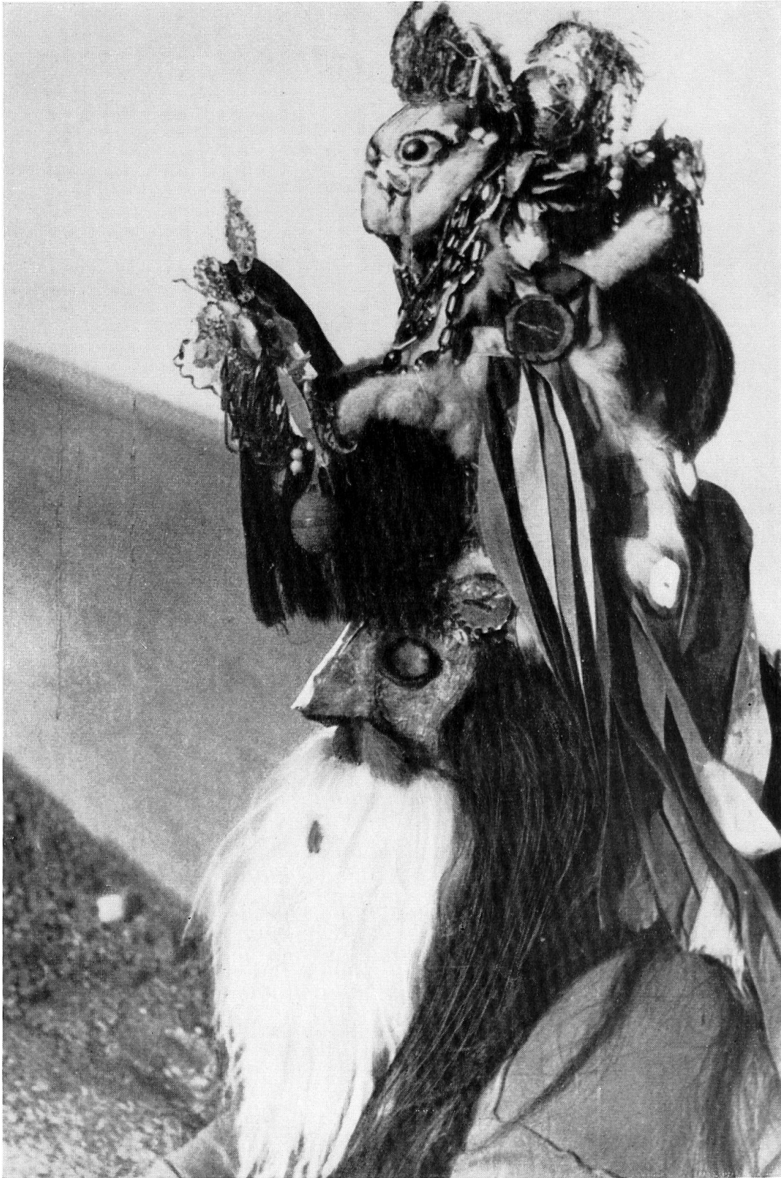
8 «Der Alte» aus dem Gebiet von Bacău. Neujahrsmaske.