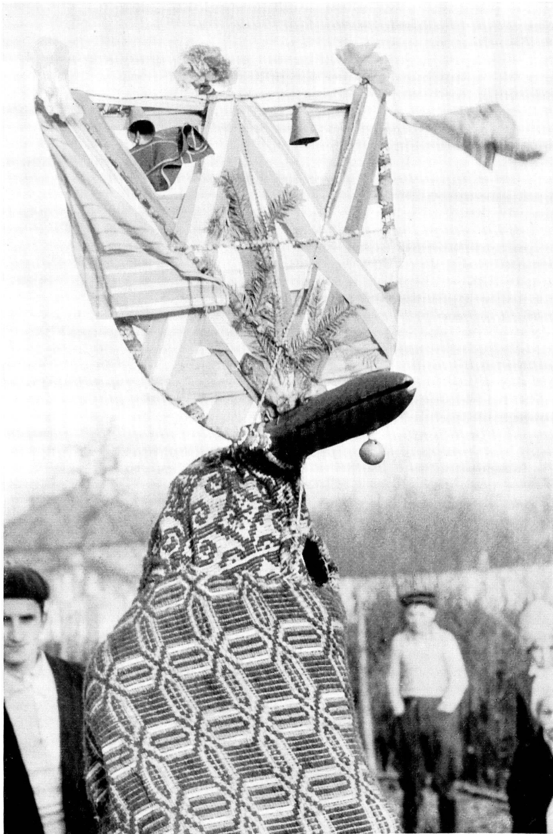
1 «brezaia», aus Muntenien. Neujahrsmaske.