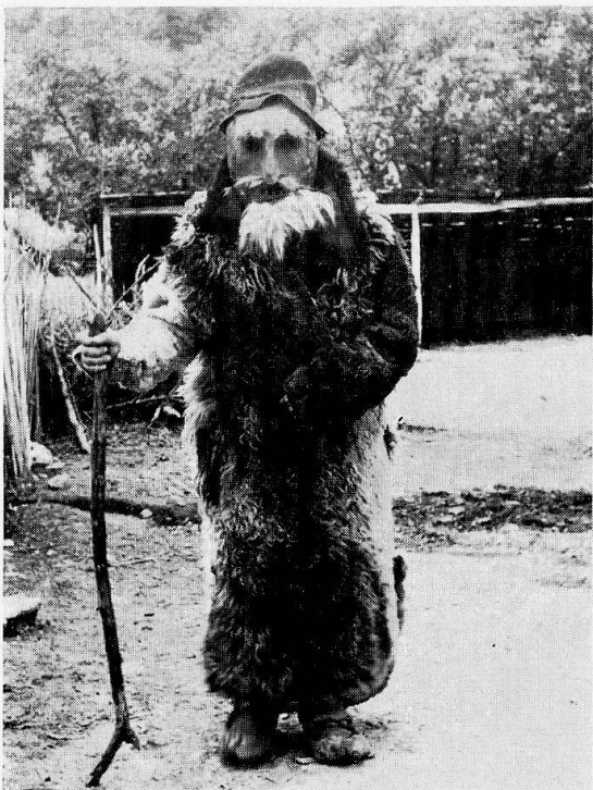
2 «Greis» oder «der Alte», aus Vrancea, gebraucht bei der Leichenwache.