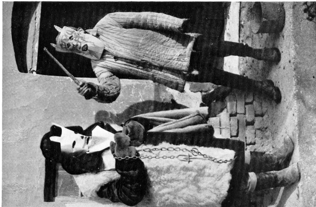
40 Die hl. Barbara und ihre Begleiter. Kimle, 1966.