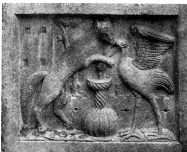
Abb. 4. Teilstück vom Grabmal für Hans Katzianer, Oberburg-Gornjigrad in Slowenien, 1539.