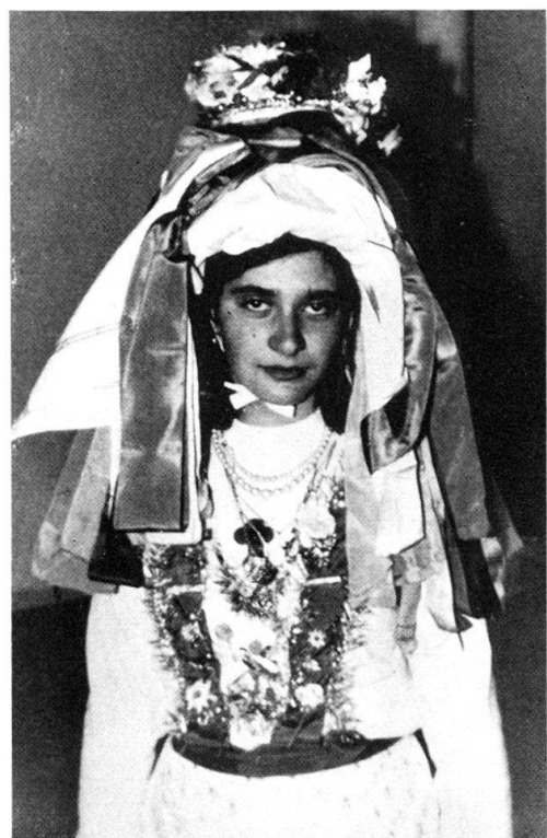
Abb. 3. Dasselbe, mit enthültem Gesicht.