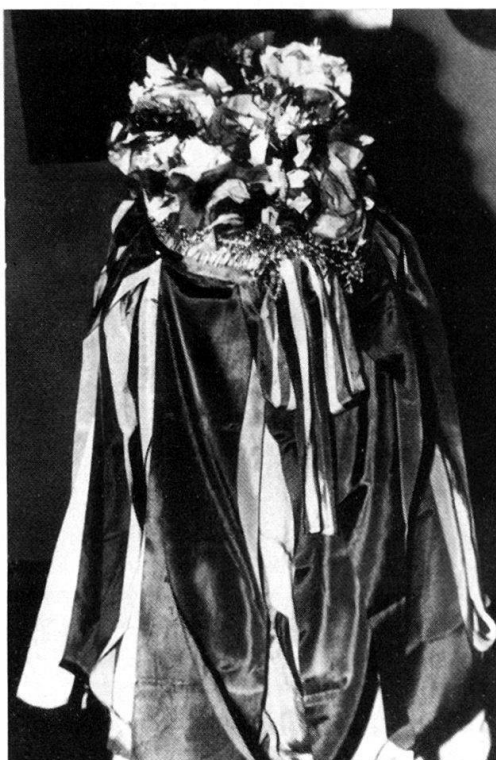
Abb. 2. Dasselbe, Hinteransicht.