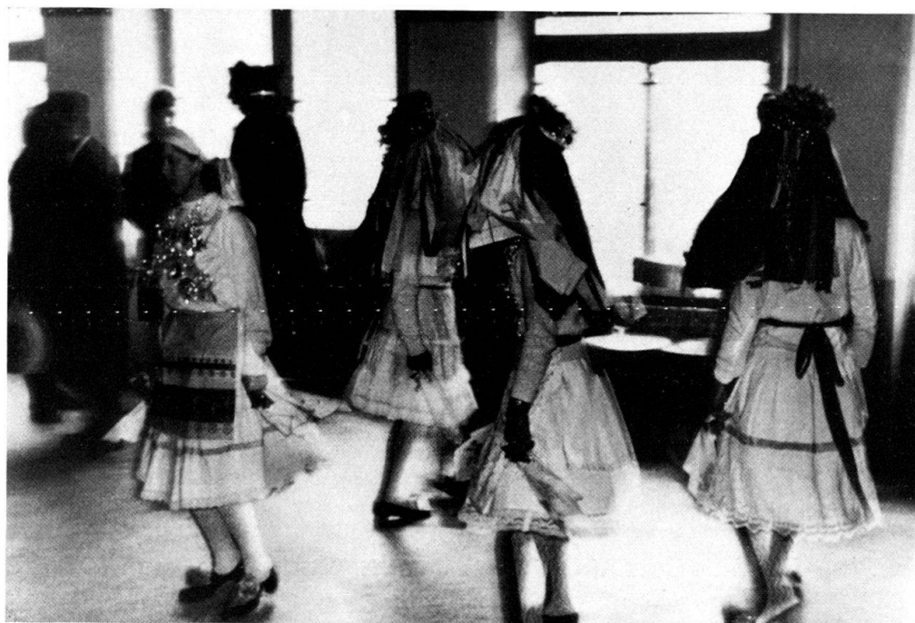
Abb. 4. Tanz der « máškare » aus dem Resia-Tal: vier mit verhüllten Gesichtern (die vierte wird von den zwei mittleren verdeckt), das fünfte Mädchen (ohne Kopfmaskierung, links) tanzt mit.