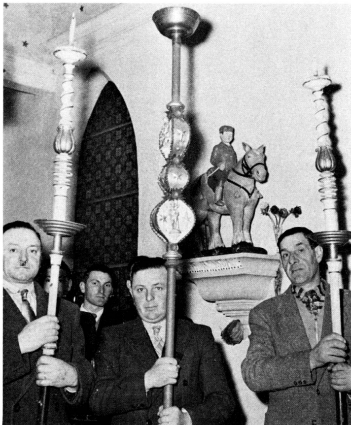
Fig. 2. Porteurs de torques.