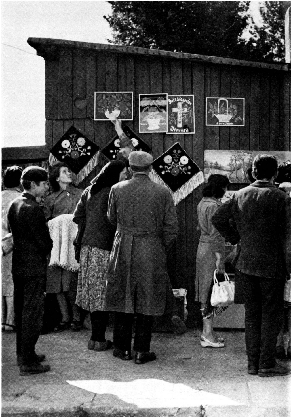
Abb. 1. Ein Jahrmarkt in Radomsko. Ein Stand mit Bildern.