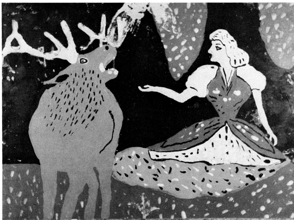
Abb. 4. Die Jungfrau und der Hirsch. Anonym, gekauft in Ochoża bei Chelm am Bug. Hinterglasmalerei, 27 × 37,5 cm.