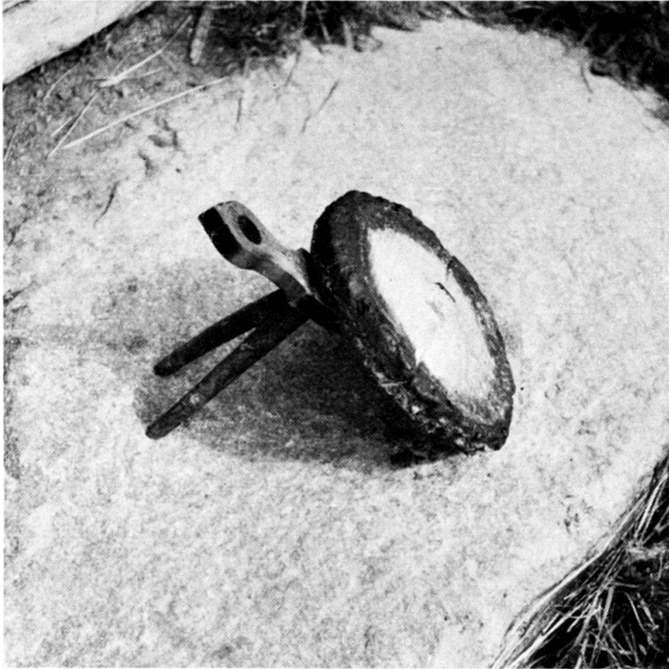
Abb. 3. Gestell aus Birke zum Backen von Käse. Die Platte konnte um eine in der Mitte befindliche Nabe gedreht werden. Auch in der Hitze gab das Birkenholz keinen Geschmack an den Käse ab. Lappajärvi, Südostbottnien.