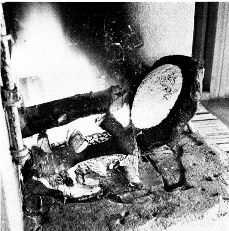
Abb. 2. Käse wird am offenen Feuer gegrillt. Zur westfinnischen Bauernstube gehörte ein offener Herd, durch dessen brennendes Feuer der Wohnraum sowohl geheizt als auch beleuchtet wurde. Veteli 1939.