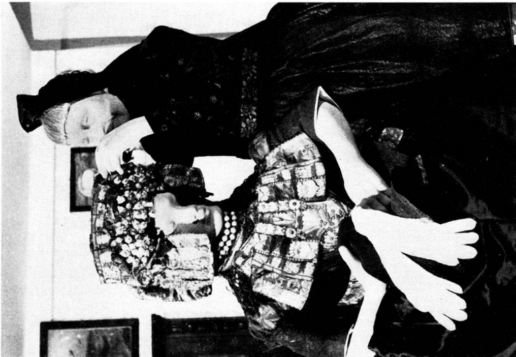
Abb. 2. Eine reiche Schwärmer Braut und die Schappelfrau.