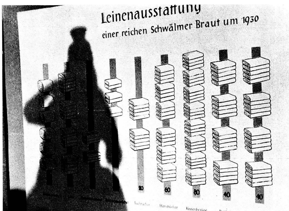
Abb. 3 und 4. Statistik der Leinenausstattung in der Ausstellung «Arm und Reich» des Universitätsmuseums Marburg.