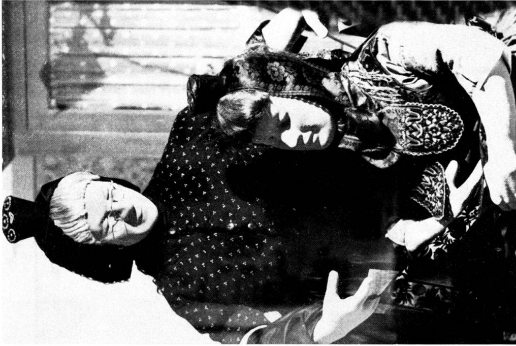
Abb. 1. Eine arme Schwärmer Braut und die Ankleiderin.