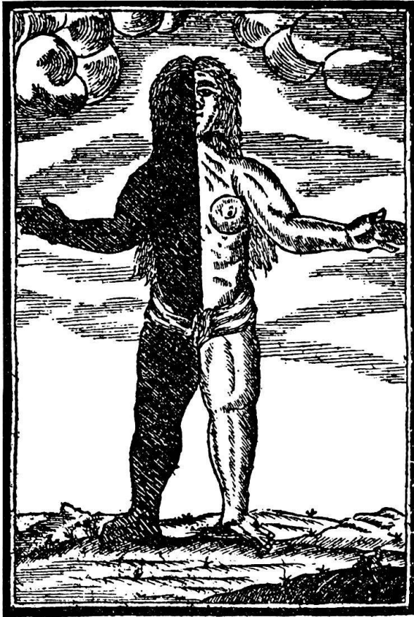
Abb. 1 «Das Weibsbild» das halb Negerin, halb Weisse war und als grosses Wunder gedeutet wurde. (Appenzeller Kalender 1783).