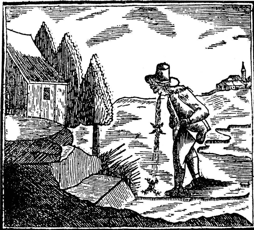
Abb. 5: «Der Kröte Trinker» Appenzeller Kalender 1790.