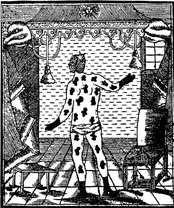
Abb. 2 Das gesprenkelte Negermädchen aus St. Lucia (Appenzeller Kalender 1784).