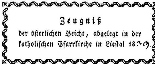
Liestal, 1839, VI 47006.

Osterbeichte 1936 Benediktinerstift St. Gallus in Bregenz