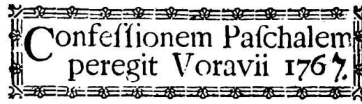
Vorau, Steiermark, 1767, VI 47005.