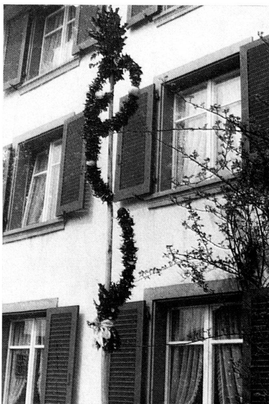
Abb. 8: Hofstetten