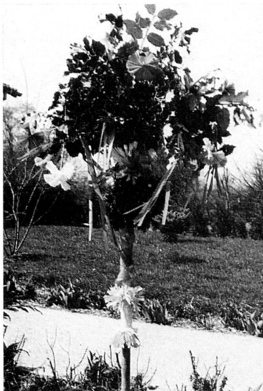
Abb. 3: Neuwiller