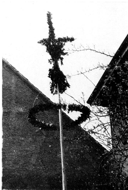
Abb. 6: Hofstetten