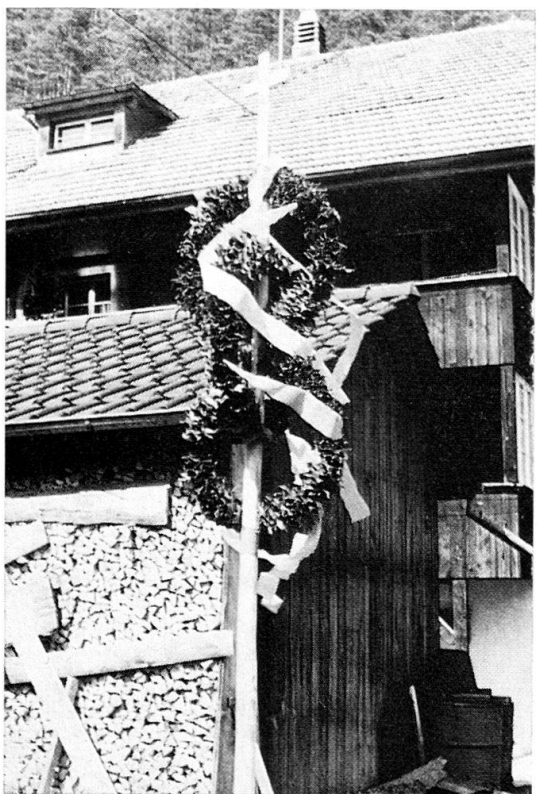
Abb. 7: Kleinlützel