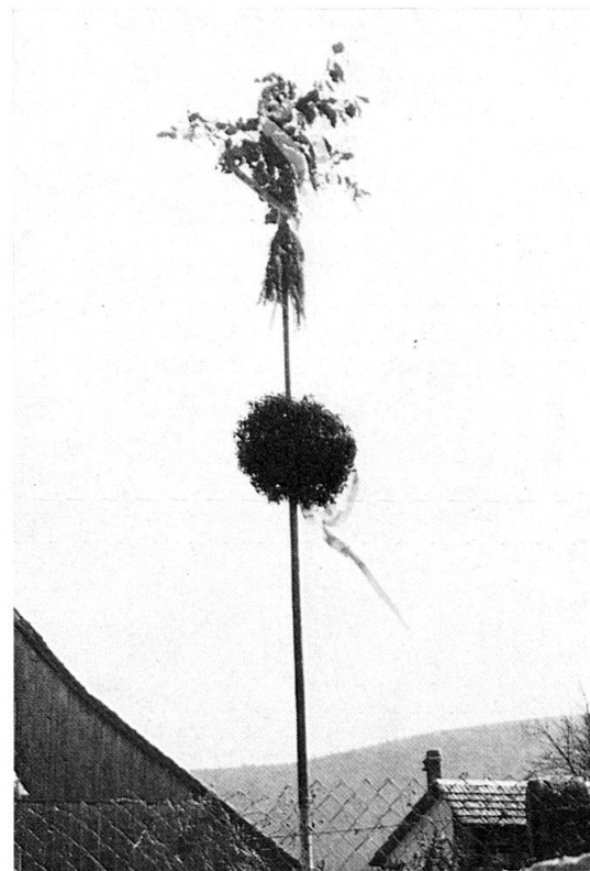
Abb. 4: Wollschwiller