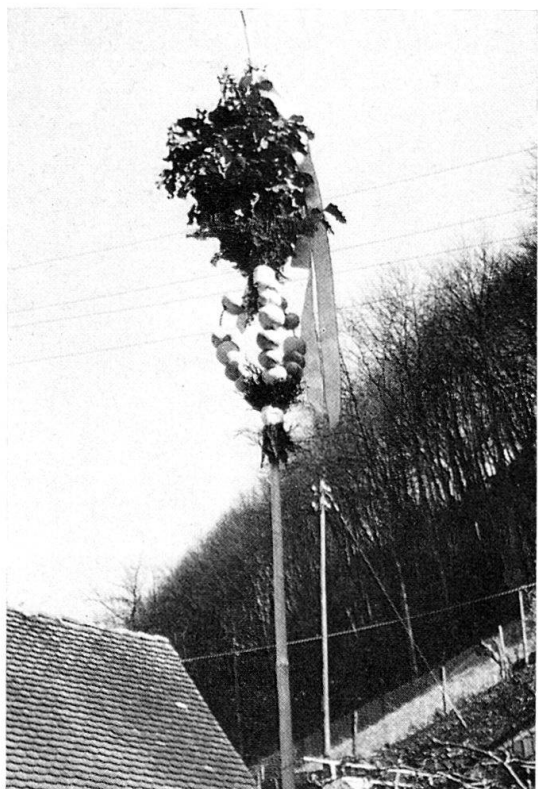
Abb. 5: Burg