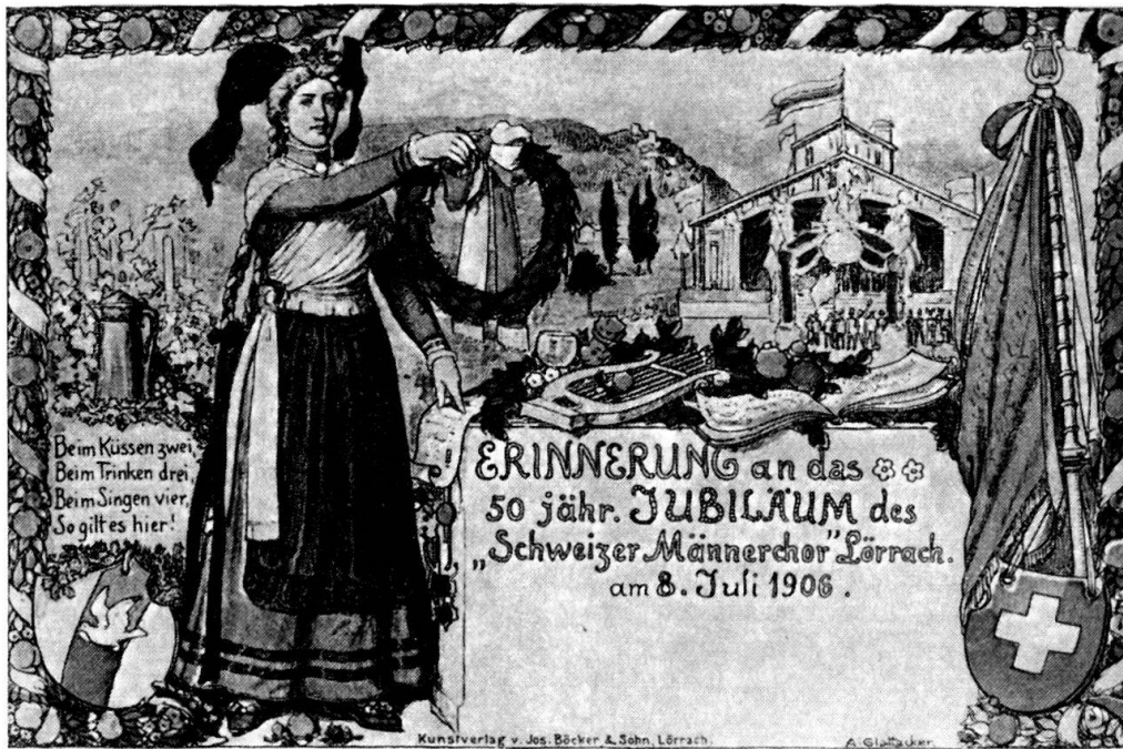
Fest-Postkarte von 1906 mit der Abbildung der eigens errichteten Festhalle. Zeichnung von Adolf Glattacker (1878–1971), dem «Engeli-Moler» von Lörrach-Tüllingen.