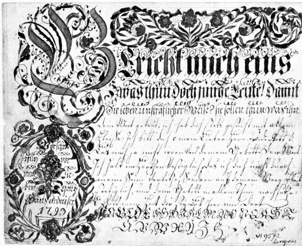
Abb. 2. «Vorschrift», kleines Format, deshalb «Vorschriftly». Langwies GR, 1793 (VI 9572).