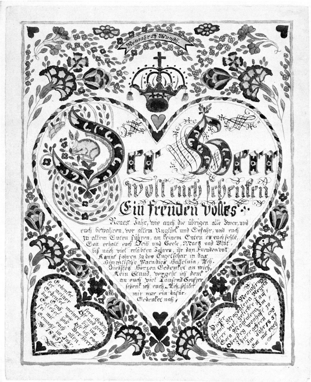
Thierachern BE, 1857, Inv. Nr. VI 47000