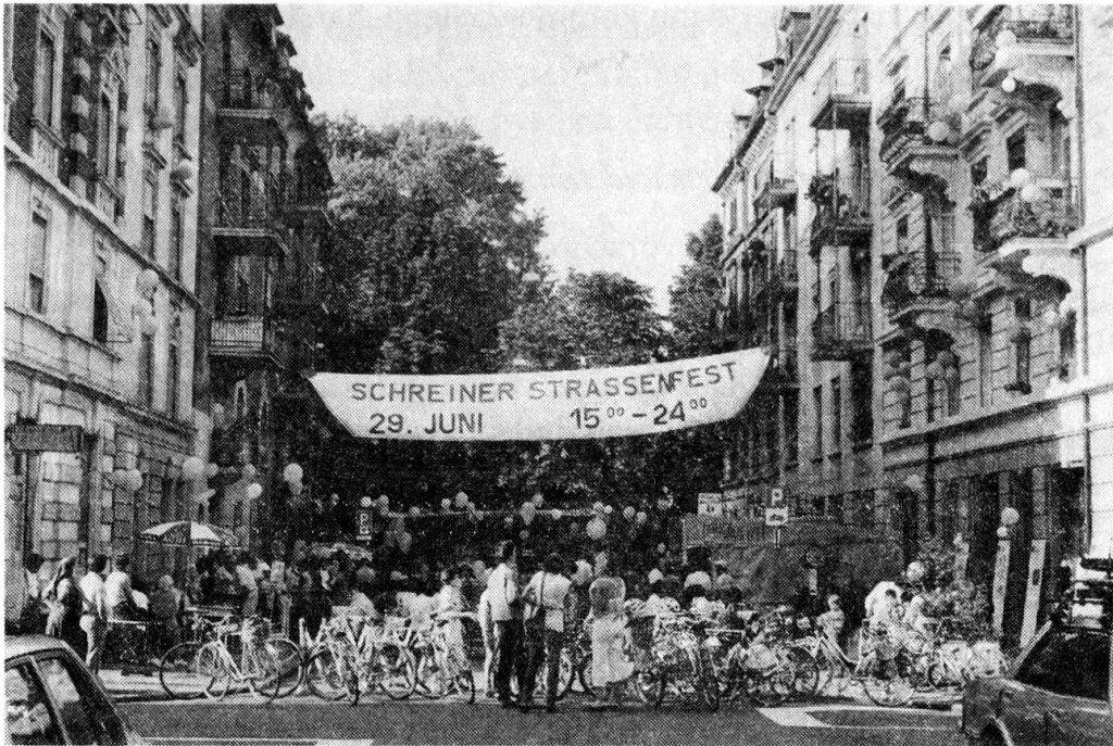
Festkultur im Quartier: Schreinerstrassen-Fest im Quartier Aussersihl.