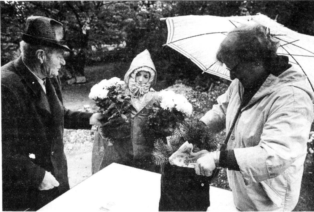
Friedhofszene 1985: Friedhof Enzenbühl, Allerseelen.