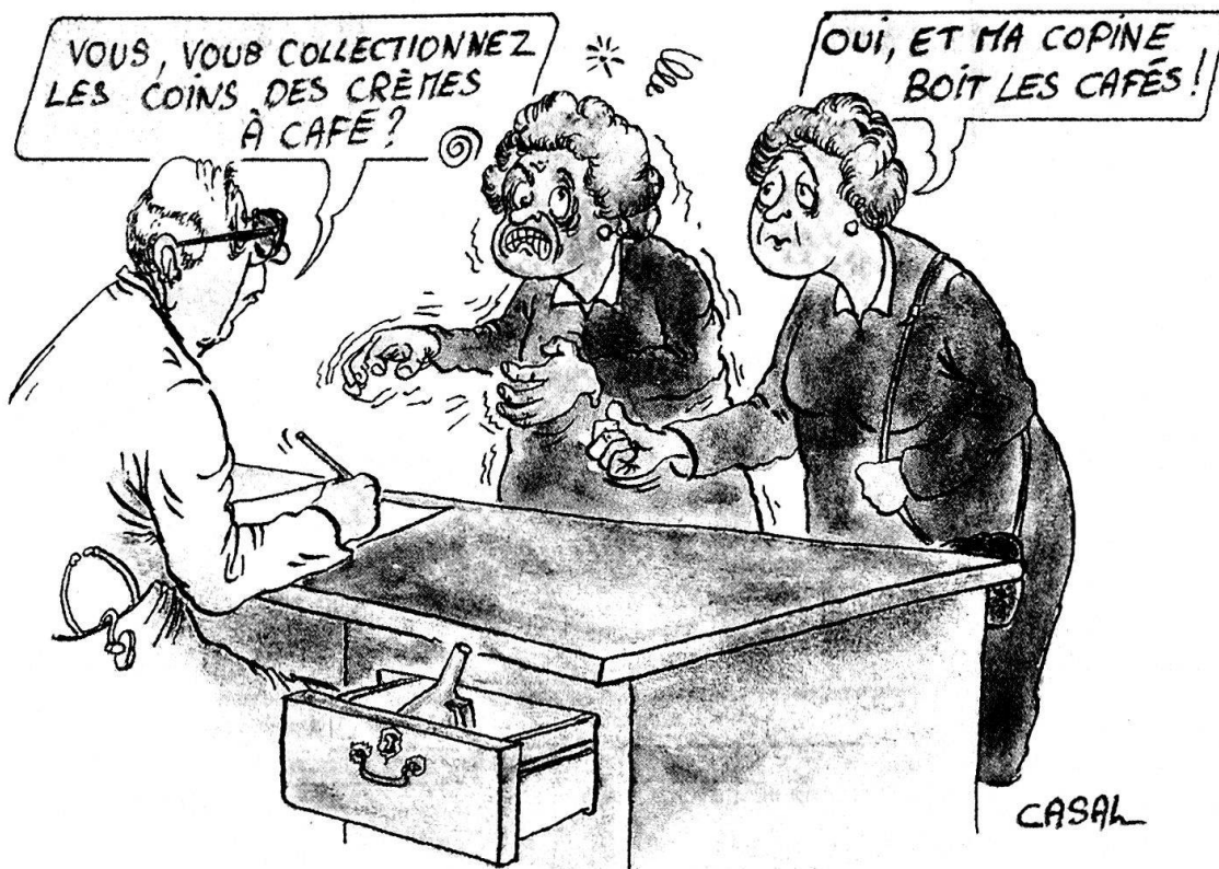
Abb. 8: Die eine sammelt die Deckeli, die andere trinkt den Kaffee. Der Cartoon aus dem Nouvelliste vom 19.12.1991 scheint einmal mehr den Beweis zu erbringen, dass in der Schweiz Sprach- und Kulturgrenzen nicht übereinstimmen.

1980er Jahren zum Volkssport. «Was jedermann sammeln kann», titelte die Frauenzeitschrift Annabelle 1980 und zählte all die «sammelbaren Kleinigkeiten» auf, die «erst entdeckt wurden und noch erschwinglich sind»: Eierbecher, Knöpfe, Email schilder, Schreibfedern... 21 Heute ist eine ganze Industrie daran, ständig neue sammelbare Dinge wie Fingerhüte, Krawatten, Porzellanpuppen, Magnete, Taschenmesser oder Zigarettenpackungen anzubieten.