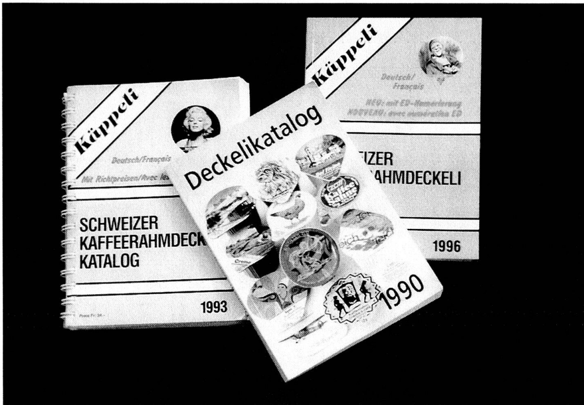
Abb. 6: Der Deckelikatalog als unerlässliches Hilfsmittel für das Sammeln und Tauschen der Kaffeerahmdeckeli.

chiges «Kade-Magazin», wie die anderen beiden im A4-Format, auf Hochglanzpapier gedruckt und in einem Umfang von 30 bis 40 Seiten.