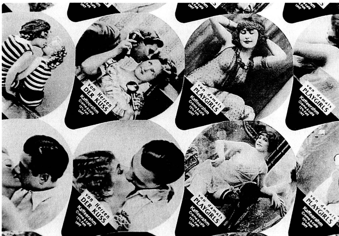
Abb. 1: Leichtgeschürzte Damen – offenbar nicht züchtig genug fürs Sammleralbum (Dezember 1993).

Firma im Dezember 1993 frivole Deckeli mit «Playgirls von damals» anbot, wurde dies von Thomas Käppeli, damals ein Grosser im Kaffeerahmdeckeli-Geschäft, verurteilt: Solche «nicht angebrachten halbnackten Damen» würde er nicht ins Verkaufsprogramm und nicht in den Katalog aufnehmen. 6 Die vollbusigen und leichtgeschürzten Frauen auf einer Merkur-Serie von 1992/93 jedoch haben keine Vorbehalte geweckt, und eine neuere Serie «Charme rétro» mit alten Fotografien von Damen in Unterwäsche hat ebenfalls keine moralischen Wellen geworfen.