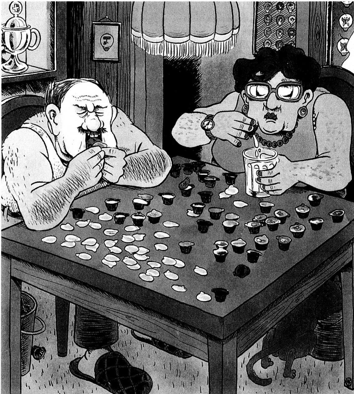
Abb. 4: Abtrennen und Aufbereiten der Deckeli als zeitgemässe Paartherapie. Cartoon im Beobachter 5/94.

könnte Tag und Nacht unterwegs sein für das ... Es hat uns nie gestunken, wir haben es gern gemacht. Aber unser Ziel ist nicht, jeden Abend Deckeli machen.» Wenn sie aber wieder eine Deckeli-Sendung – eine «Wunderkiste» wie sie es nennen – erhalten haben, kann es schon vier Uhr morgens werden. Markus schlitzt die Rahmkübeli am Boden auf und leert den Rahm in ein Gefäss 16 , seine Partnerin schneidet das Kübeli direkt unterhalb des Deckels durch und legt das Ganze in Benzin zum Ablösen. Wahre Sammler reissen eben das Deckeli nicht einfach ab, es könnte kaputtgehen oder stark verknittern. Anschliessend wird mit einem Spülmittel gewaschen,