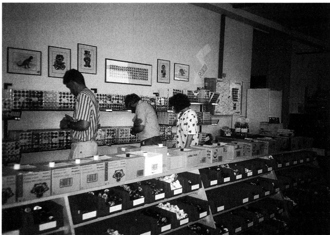
Abb. 2: Ob rares Sujet oder unentbehrliches Werkzeug für die Aufbereitung des Sammelgutes – in diesem Geschäft der Kade-Vertriebs AG im Bernischen Bowil kommen alle auf ihre Rechnung.

um die Deckeli für die Eröffnung zurechtzumachen, zu waschen, zu glätten und zu ordnen. Die Rahmdeckeli fanden grossen Anklang, aber was dem frischgebackenen Deckelihändler aufstiess, waren die mangelnden Unterlagen: Man wusste nicht, was es überhaupt gab, was man eigentlich sammeln konnte. Daraus entstand die Idee eines Katalogs, von dem noch zu berichten sein wird. Nun kamen Dekelisammler zu Käppeli und boten ihm ihre Sammlungen an, andere baten ihn um Hilfe bei der Suche nach Fehlendem. Er versuchte zu helfen und zu vermitteln. Er orientiere sich, sagt er, immer daran, «was die Leute wollen». Mit der Zeit wurde das Hobby, das Sammeln und das «Händele» 10 zum zweiten Beruf. Von der Münzenstube in Thun zur Kade-Vertriebs AG im Emmental – mit teilzeitangestellten Hausfrauen, die die Kaffeerähmli in Heimarbeit für den Versand zubereiteten und mit Franchisingpartnern in der ganzen Schweiz – war es aber noch ein schwieriger Weg.