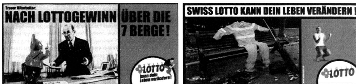
Ein Beispiel der Werbekampagne aus dem Jahr 2000

Raúl, dessen Aussage hier stellvertretend für alle ähnlichen Einschätzungen steht, widerspricht damit der Idee der Werbekampagne mit dem Motto: «Lotto kann dein Leben verändern», die seit einigen Jahren dem Zahlenlotto zu einem weniger biederem Image verhelfen soll und neue Spielerkreise ansprechen möchte.