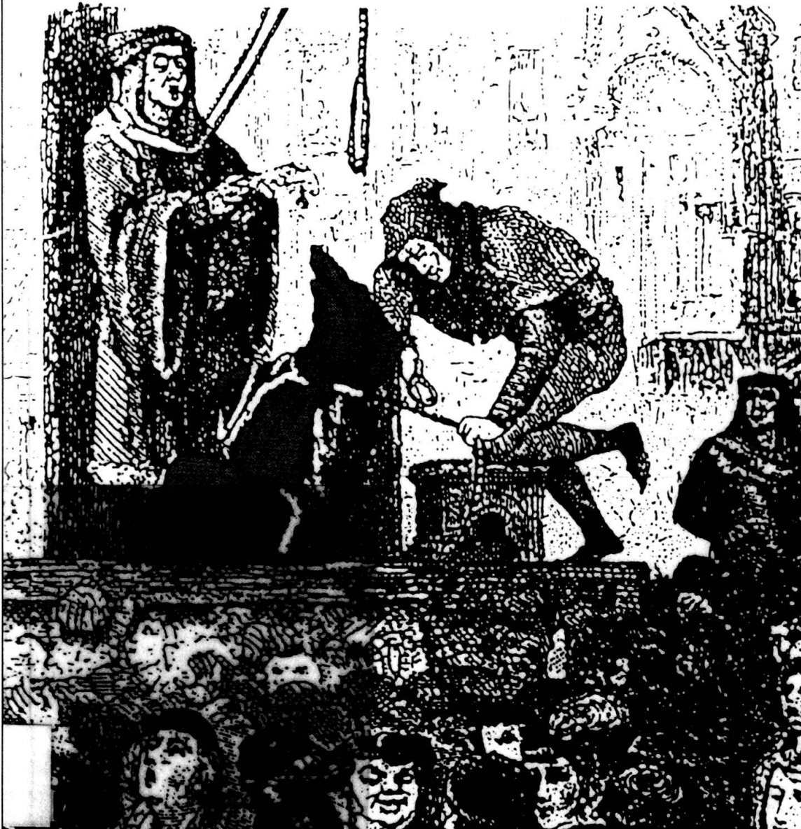
Abb. 8: So wurde im Spätmittelalter Tieren der Prozess gemacht.