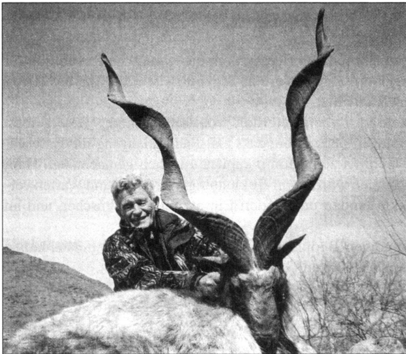
Abb. 7: Der Jäger lässt sich mit seiner Trophäe ablichten.