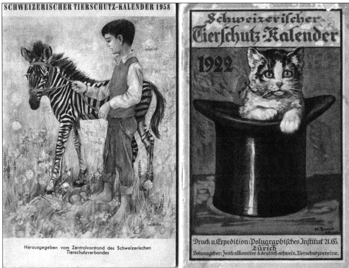
Abb. 10: Titelbilder des Schweizer Tierschutzkalenders 1922 und 1958 als Beispiele der kulturellen Vermittlung der neuen Mensch-Tier-Beziehung.

dem Verlust der Bindungen an die unverfälschte Natur und als Gegenwelt zur zunehmenden Technisierung der Umwelt popularisierte und demokratisierte sich eine neue Art der Tiernutzung, eine neue Beziehung zum Tier bildete sich heraus, die Tierliebe .