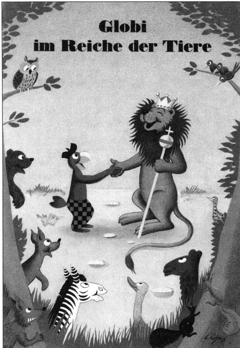
Abb. 3: Tiere als Helden, so wie hier im Buch «Globi im Reich der Tiere», erfreuen ein grosses Publikum.

menschlichen Lebens kaum zu interessieren scheinen, und es erstaunt, wie selten Geschichte, Psychologie, Soziologie und auch die Ethnologie die Mensch-Tier-Beziehung thematisieren. Auch in der Volkskunde, die von ihrem Selbstverständnis her den lebensweltlich-alltäglichen Handlungen und Erfahrungen zugeneigt ist – und zu dieser Lebenswelt gehören Tiere und Kontakte mit Tieren –, ist es nicht anders. Unter den rund 1000 Titeln aktueller volkskundlicher Abschlussarbeiten der Jahre 2002 und 2003 an deutschsprachigen Universitäten sind gerade zwölf, die man im allerweitesten Sinn mit Mensch-Tier-Beziehungen in Zusammenhang bringen könnte. Eine Internetrecherche ergab, dass zwischen dem Sommersemester 1999 und dem Sommersemester 2004 in deutschsprachigen volkskundlichen Instituten sieben Veranstaltungen zum Thema Mensch und Tier angeboten wurden.