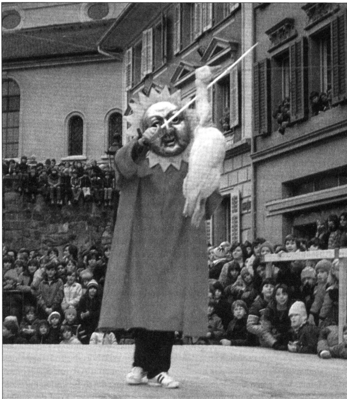
Abb. 9: Gansabhaut in Sursee.

schwarze Hähne, Katzen oder Schlangen verwendet. Bauopfer, lebende oder tote Tiere z.B. unter der Schwelle eines Bauwerks eingemauert, dienen ähnlichen abwehrenden Zwecken und sind in vielen Kulturen nachweisbar.