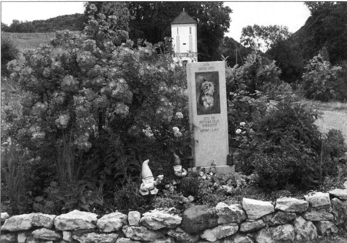
Abb. 11: Ein Grab auf dem Tierfriedhof «Am Wisenberg» in Läuelfingen/BL.

Rechtlich betrachtet ist der Tierfriedhof ein Wasenplatz, ein Ort, an dem früher verendete oder kranke Tiere vom Wasenmeister vergraben wurden. Solche Wasenplätze gibt es seit den 1970er-Jahren in der Schweiz nicht mehr, einzig für den Fall von Tierepidemien sind solche Plätze vorgesehen. Für den Tierfriedhof musste diese Einrichtung wieder eingeführt werden.