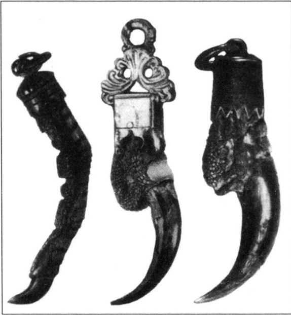
Abb. 6: Mit Amuletten, hier aus Krallen, versuchen Menschen, sich tierische Kräfte anzueignen.