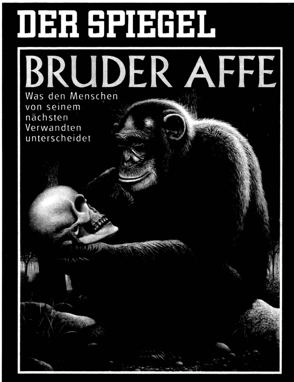
Abb. 4: Oft sind es die «menschlichen» Eigenschaften, die uns an Tieren ansprechen.

Aber auch durch «menschliche» Eigenschaften sprechen uns die Tiere an: Geburt, Aufzucht der Jungen, Abhängigkeit von Nahrung und Wasser, Schlaf, Verwundbarkeit und Sterblichkeit haben sie mit uns gemein. Der Mensch hat sich dem Tier nah und fremd zugleich gefühlt, es war Mitkreatur in der heiligen Ordnung (Abb. 4).