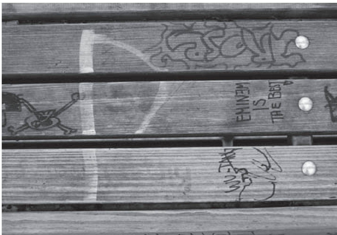
MFO-Park: Spuren

Generell beruht die intergenerationale Wahrnehmung und Einschätzung vor allem auf nonverbalen Ausdrucksformen und ist stark von Vorurteilen geprägt: Spuren von Kindern wurden meist milder beurteilt, nicht nur, weil sie besser entfernt werden konnten, sondern auch, weil Jugendlichen Vorurteile entgegengebracht werden: Es herrscht ein anderes Bild der Bedeutung von kreativer Aneignung für Kinder und Jugendliche vor. Einerseits wird Kindern mehr Kreativität zugebilligt, andererseits wird jugendliche Raumveränderung a priori negativer besetzt. Spuren – Sprayereien, Zerstörungen – in den Parks werden hingegen von den Jugendlichen bestimmten Akteuren zugeordnet – es handelt sich daher um Codes innerhalb der Raumtextur, deren Bedeutung Jugendliche als Experten lesen.