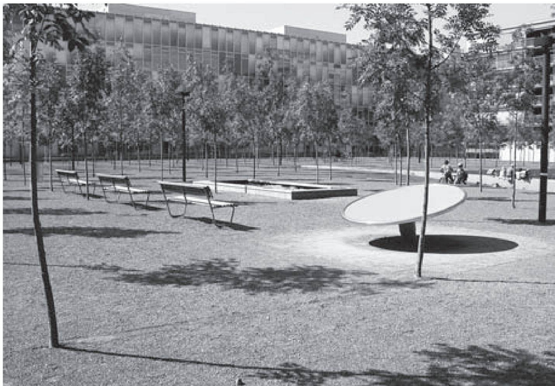
Oerliker Park

Prämissen dieses ökonomisch, sozial und politisch bestimmten Handlungsfeldes der Jugendlichen stehen in Bezug zu generationally ungleich verteilten Ressourcen der Bedeutungsgenerierung: Die Analyse von diskursiven Strategien von Politikern, Investoren, Planern usw. anhand von Printmedien während der Entstehungszeit des Quartiers verdeutlicht entsprechende Aneignungsprozesse der Erwachsenenwelt: Neu-Oerlikon wird angeeignet, indem eine homogene Deutung des Begriffs Urbanität verbreitet wird. Das wichtigste Bild, das mit Urbanität konnotiert wird, ist dasjenige des harmonisch durchmischten Stadtteils , das sich weniger auf eine sozial durchmischte Bewohnerschaft, als auf das Nebeneinander von Arbeit, Dienstleistungen, Freizeit und Wohnen bezieht. Urbanität wird mit mittelständischer, gutverdienender, ruhiger und sauberer Bewohnerschaft konnotiert, die geregelter Arbeit nachgeht, sich nach Feierabend «urbanen» Konsumtätigkeiten hingibt, um dann in urbanen Behausungen Energie für den nächsten Arbeitstag zu schöpfen.