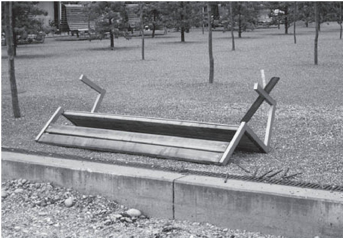
MFO-Park: umgestürzte Bank

Dem von Erwachsenen produzierten Sozialraum schreiben Jugendliche im Alltag neue Bedeutungen ein und destabilisieren damit normative Vorgaben der Erwachsenenwelt. Die Analysen zur Raumchoreographie des MFO-Parks verdeutlichen denn auch typische Funktionen öffentlicher Räume für Jugendliche und gleichzeitig eine charakteristische Grammatik jugendlichen Sozialraumverhaltens mit vor allem nonverbalen Ausdrucksmitteln: laut sein, sprayen, Repräsentationsverhalten, Rückzug in Nischen, beobachten. Diese Interaktionsmuster stehen für die Ambivalenz der Jugendlichen zur Erwachsenenöffentlichkeit zwischen Teilnahme durch verdeckte bzw. nicht direkt verbal geäußerte Provokation und dem Bedürfnis nach Abgrenzung.