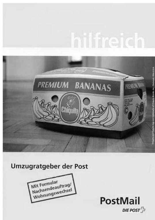
Die Schweizerische Post/Prospekt August 2004