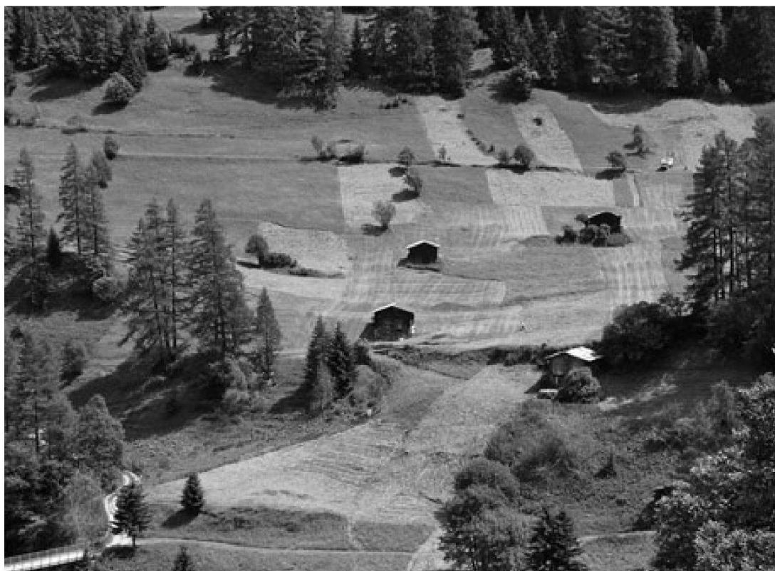
Abb. 4: Zur Heuernte enthüllt sich für kurze Zeit die Parzellenstruktur des Wieslandes