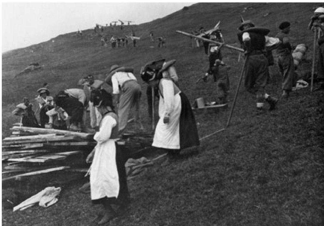
Abb. 1: Holztragen auf die Lauchernalp, 1936.

In den deskriptiven Talmonographien der älteren Volkskunde, insbesondere bei Friedrich Gottlieb Stebler (1842–1935) und Hedwig Anneler (1888–1969), wurde mit dem zeittypischen «ethnographischen» Blick der Elitekultur bürgerlicher Gesellschaften um die Jahrhundertwende die Gegenwelt des alpinen Lötschentals betrachtet. 5 Dabei wurde eine alpine Kultur suggeriert, bei der alle Bergbauern derselben landwirtschaftlichen Arbeit mit demselben Aufwand und derselben Mühe nachgingen. Zusätzlich erzeugten die ausführlichen Darstellungen der genossenschaftlichen Arbeitsorganisationen wie das Gemeindewerk, das Alpenwerk und das Holztragen (allesamt Formen des Gemeinwerkes im Sinne Arnold Niederers) nahezu sozialistisch anmutende Gesellschaftsbilder (vgl. Abb.1.).