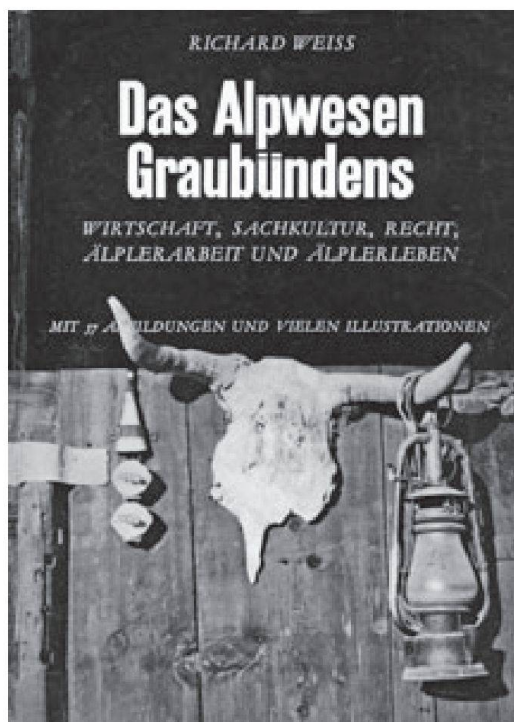
Abbildung 1: Das Alpwesen Graubündens : Buchumschlag 1941

Doch nun zur letzten der drei Alpenstudien: Es ist kein Buch, sondern ein 15-seitiger Artikel, erstmals erschienen in der Zeitschrift des Schweizerischen Alpen-