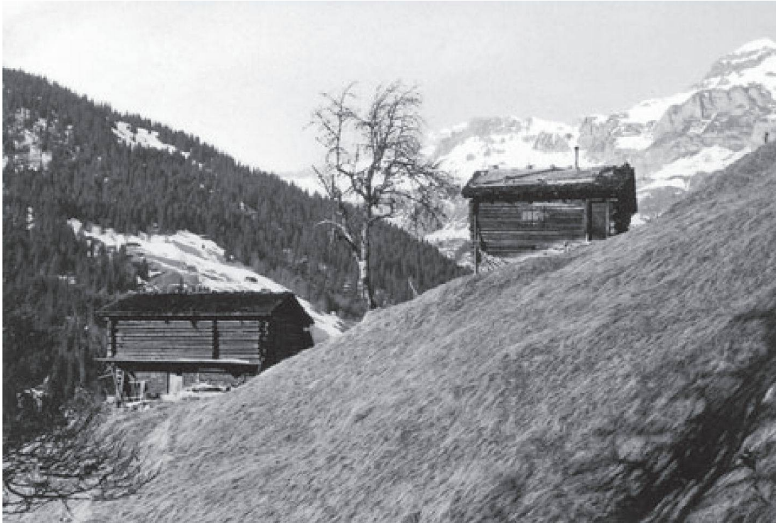
Maiensäss Tersana mit Hütte und Stall.