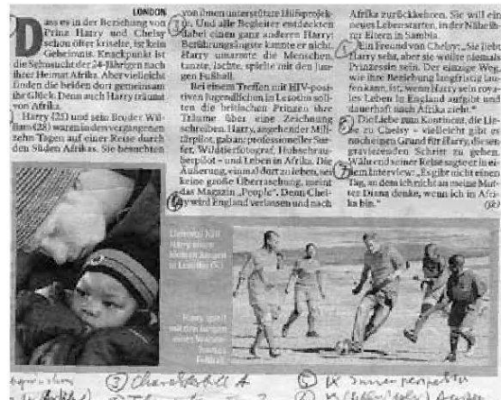
«Hamburger Morgenpost», 22.6.10, S. 64