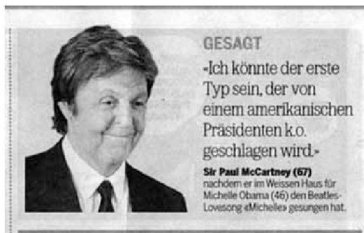
«20 Minuten», 4.6.10, S. 19