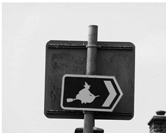
Abbildung 1: Wegweiser mit Hexe mit Spitzhut auf Besen

Brauerei verschiedene Sorten Hexen-Ale braut, Pubs ihren Namen tragen, Lokalbusse mit den Namen der Verurteilten verkehren und ihr Signet – eine Hexe mit Spitzhut auf einem Besen – als Kennzeichnung für Wanderwege und Autostrecken dient. Die Pendle Witches sind zum Kulturerbe und zur ökonomischen Ressource geworden.