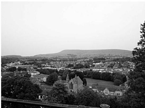
Abbildung 4: Pendle Hill von Clitheroe aus