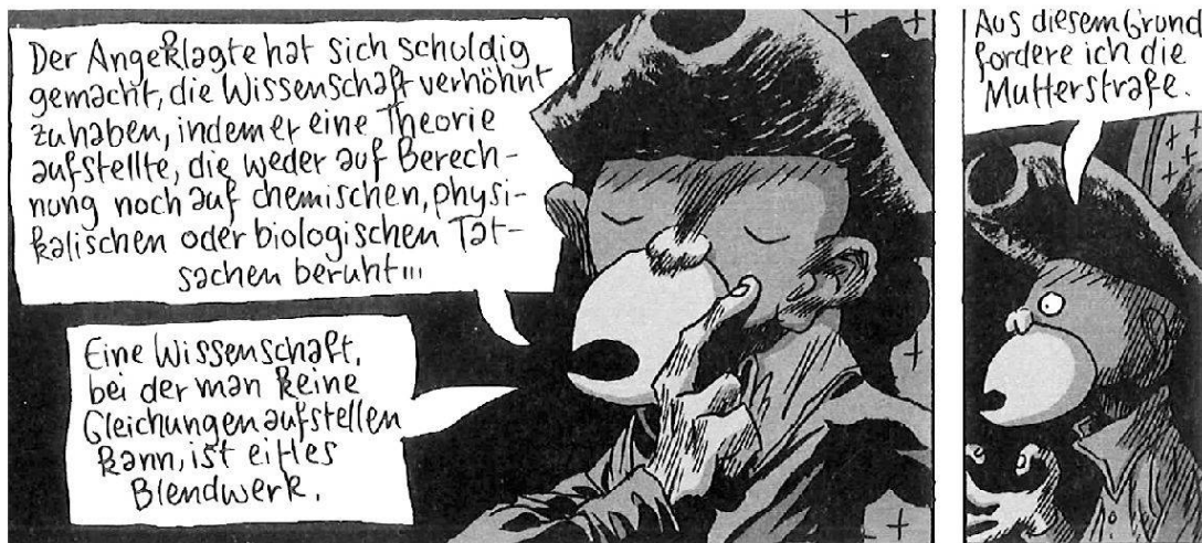
Abb. 2: Freud vor Gericht 35