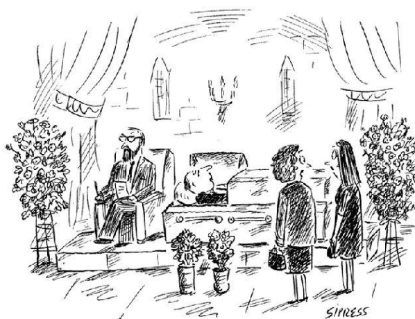
Abb. 1: He's still in therapy 24