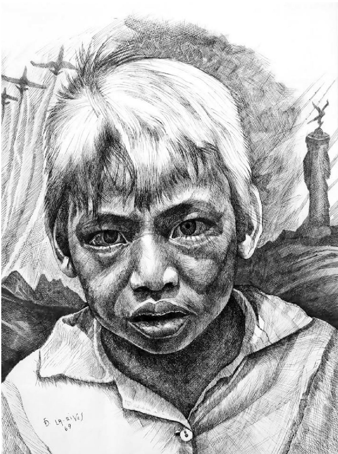
Abb. 3: Das Flüchtlingskind, 38×28 Mischtechnik auf Karton 1969