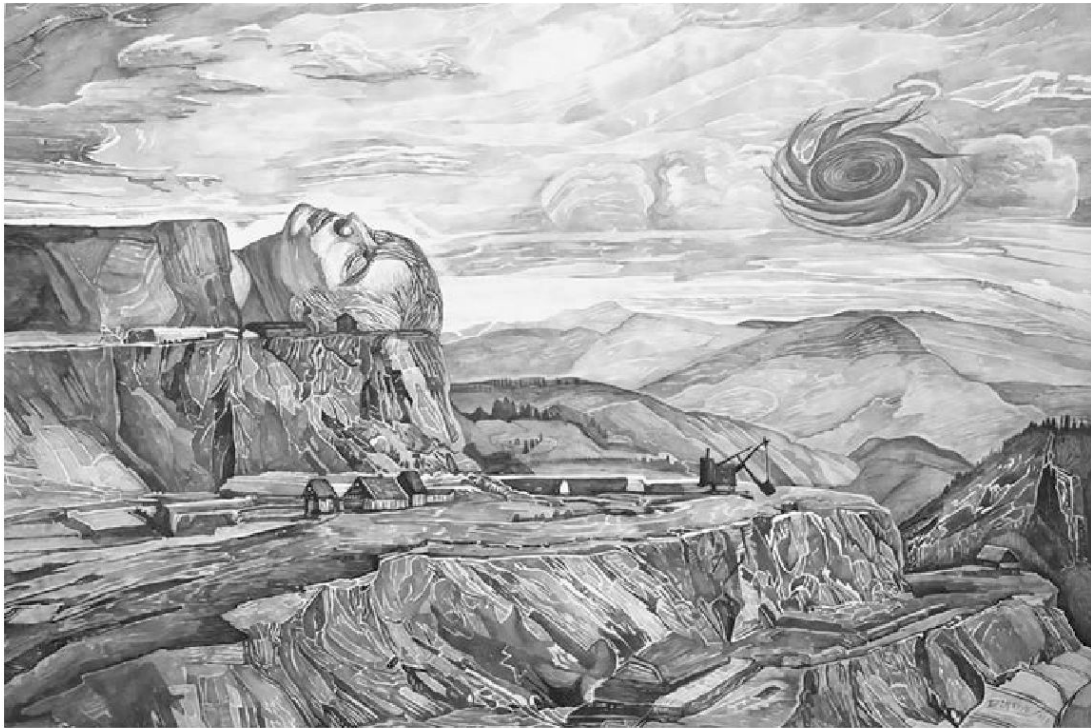
Abb. 4: Berg(ab)bau, 65×59 Aquarellmalerei auf Karton 1989