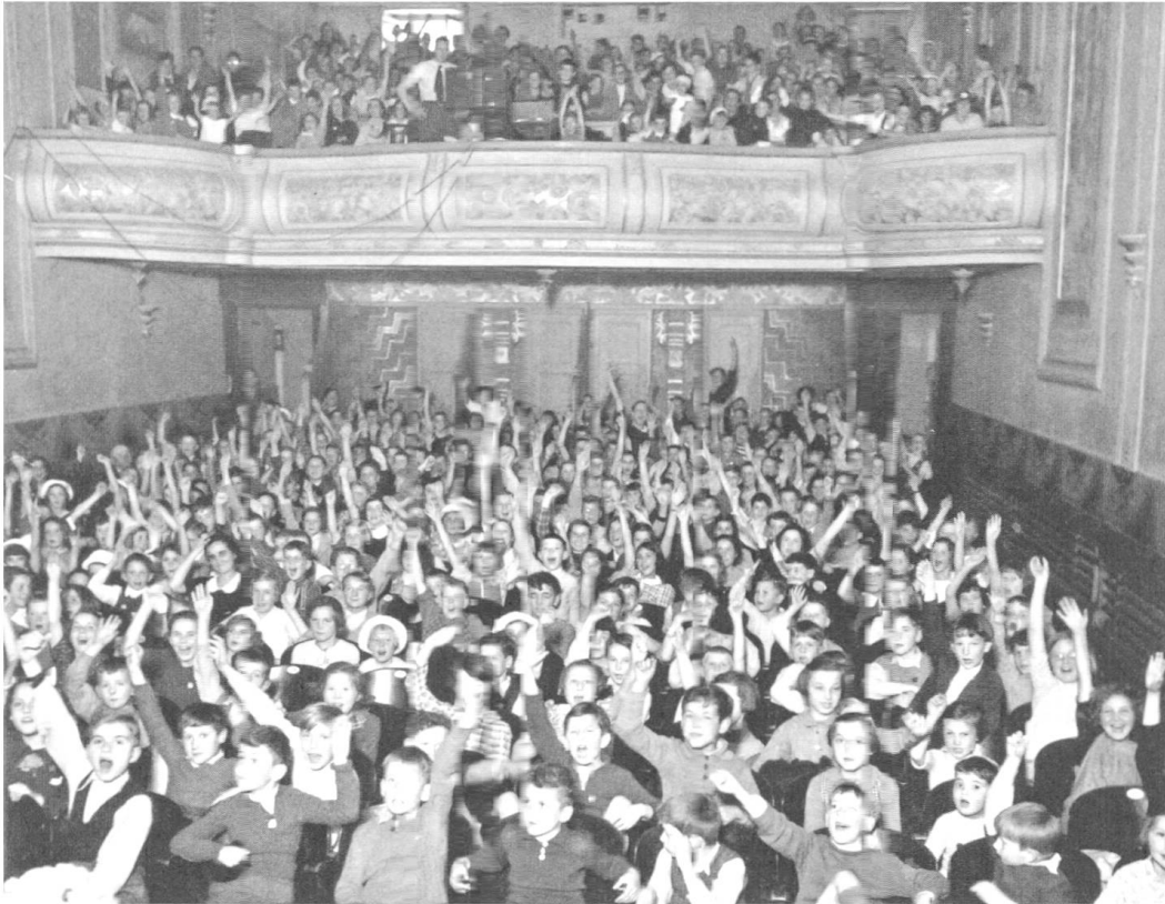
Fip-Fop-Publikum im Kino Oriental in Vevey, 26.10.1938