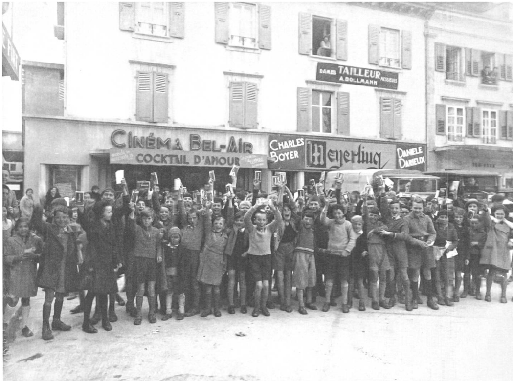
Fip-Fop-Mitglieder vor dem Kino Bel-Air in Yverdon 1937 (Archives Historiques Nestlé, Vevey)