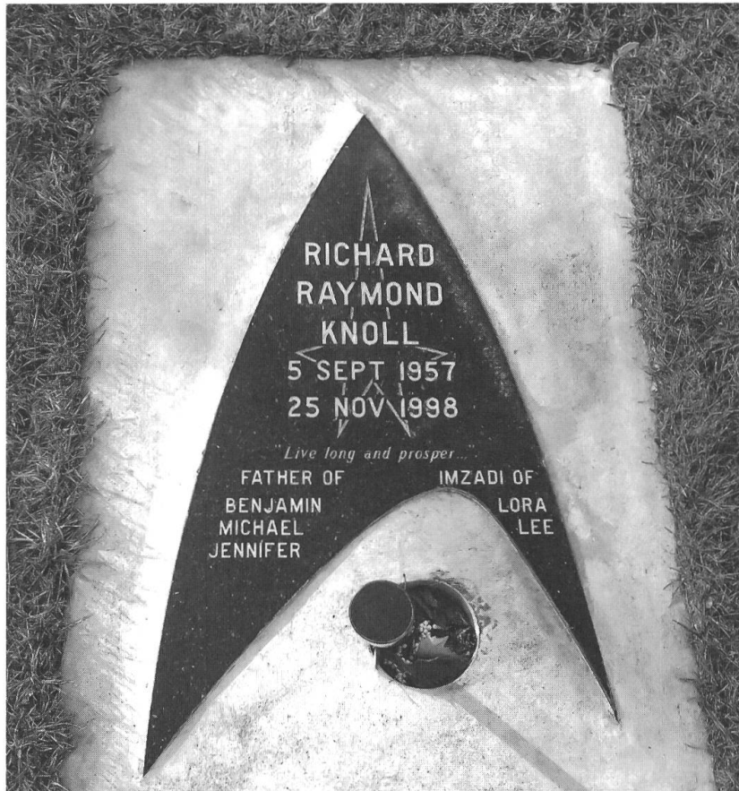
Abb. 3: Grabstein von Richard Raymond Knoll, Foto: Eli Lucero.

Familiengeschichtlichen beziehungsweise übergenerationellen Ansätzen sollte meiner Ansicht nach zukünftig mehr Aufmerksamkeit geschenkt werden.