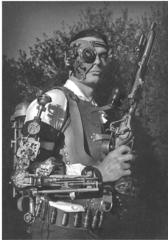
Abb. 2: Steampunker in Borg-Optik.

Ein Mittelding von Fan-Art und Fan-Fiction ist die Umsetzung in der Lego-Welt. Es gibt eine Vielzahl von Lego-Adaptionen: von Nachbauten von Raumschiffen bis hin zu sogenannten Brickfilmen, also Filmen mit Legofiguren, die in Stop-Motion-Technik produziert werden. 21 Gerade die Filme lassen nicht nur ein profundes Wissen und Liebe zum Detail bezüglich der Originalserie erkennen – bis hin zur üblichen Werbepause –, sondern sie bezeugen auch den kreativen und innovativen Umgang mit der Science-Fiction-Serie. Das meint nicht nur den Transfer in die Lego-Welt, denn von Lego gibt es keine offiziellen Star-Trek -Lizenzprodukte – im Gegensatz etwa zu Star Wars –, sodass alles, bis hin zu Spocks Spitzohren, von den Fans selbst gestaltet werden muss. Gemeint ist vor allem der Plot, der im Original kein Pendant besitzt. In Lego-Star-Trek wird also von den Fans etwas völlig Neues geschaffen. Die Fanprodukte bestechen dabei nicht selten durch ihre Qualität – inhaltlich und technisch – und stehen den professionellen Produkt(ion)en handwerklich in nichts nach. 22