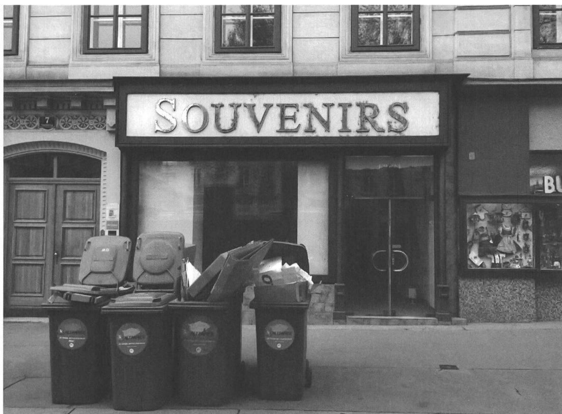
Abb. 4: Verkaufsstelle an der Wiener Ringstrasse, 2018.

tenfasständer, USB-Stick statt Federhalter) auch vor hundert Jahren schon dort gestanden haben.