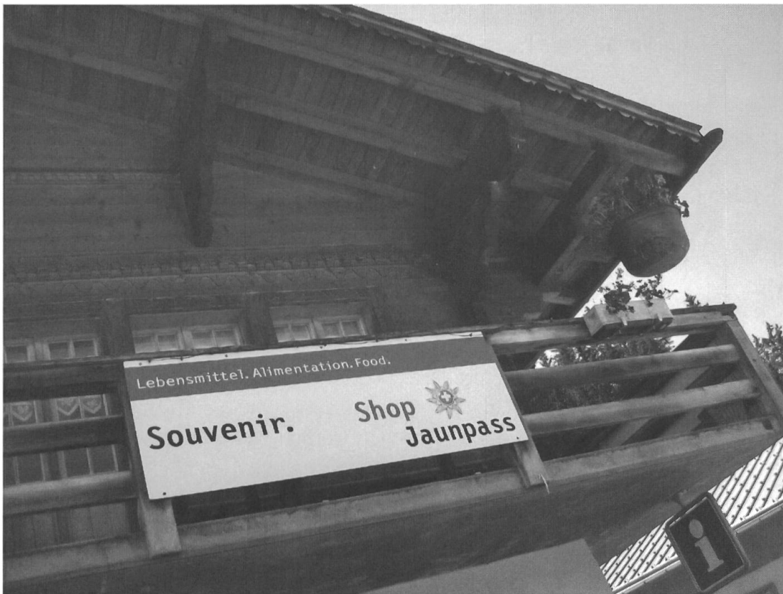
Abb. 2: Verkaufsstelle auf dem Jaunpass, 2010.

net sie als «transformierte Gebrauchsgegenstände», als einst durchaus praktikable Alltagsdinge, die nun fern ihrem ursprünglichen Einsatzgebiet neu gestaltet eine soziale oder kulturelle Aufgabe zu erfüllen haben. Neben der Kategorie der Andenken («commemorative objects») lässt sich, so Basalla, das Prinzip der Transformation auch bei Spielzeug, bei zeremoniellen und rituellen Objekten sowie in Kitsch und Kunst beobachten. Als Beispiele nennt er den wegen seines Dekors nicht brauchbaren Souveniröffel, den Bischofsstab, der nur symbolisch Schafherden lenkt, aus edukativer Absicht miniaturisierte Puppenküchen, den Salzstreuer in Form einer Glühbirne und Marcel Duchamps ikonische Fontäne.