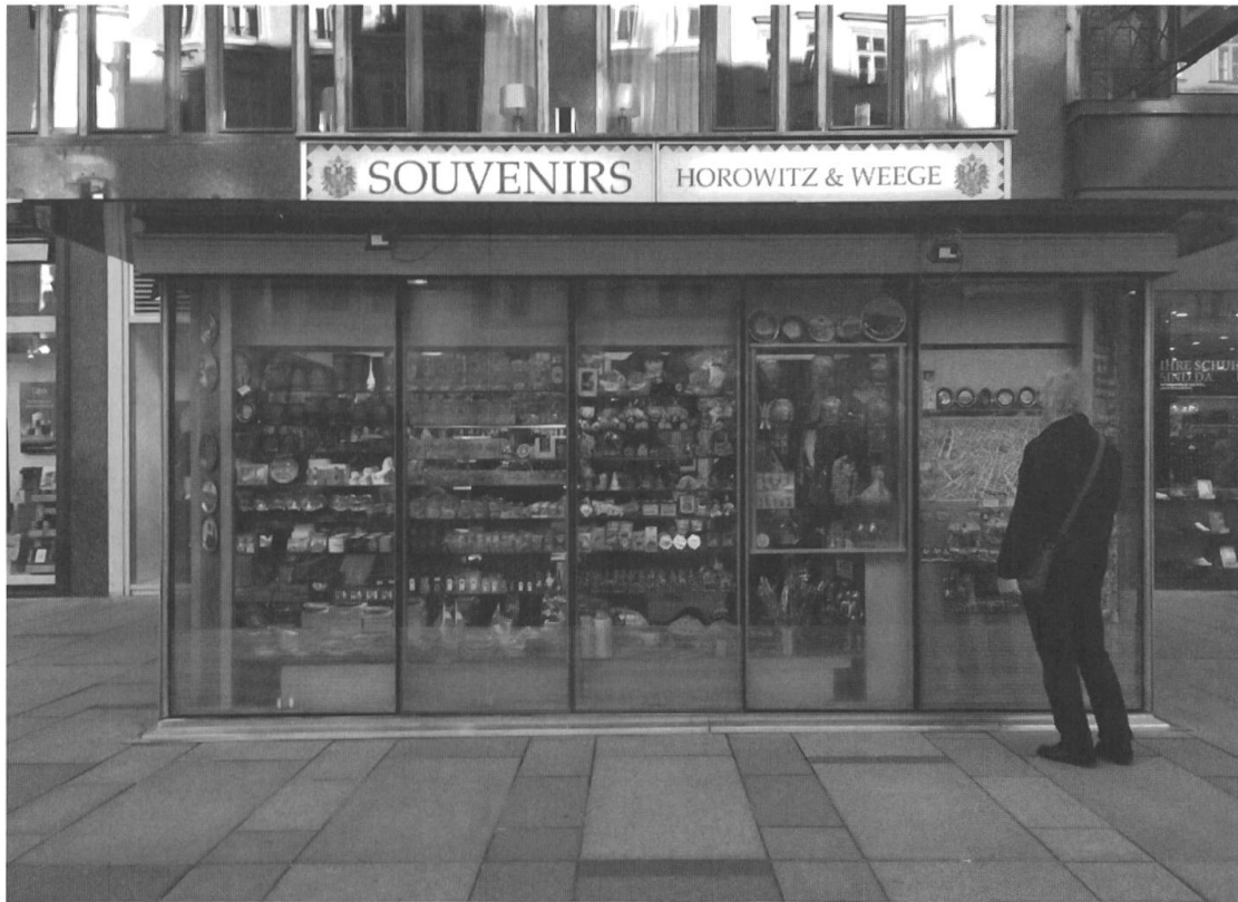
Abb. 3: Verkaufsstelle in der Wiener Innenstadt, 2018.

Souvenirs gehören zum touristischen Zeitalter, zum Reisen als Aufsuchen markierter Orte, zum Reisen als Industrie, zum Reisen als visuelle Erfahrung, zum Reisen als Versuch, mit dem Anderen und seiner Andersartigkeit einen – wenn auch hilflosen – Kompromiss zu schliessen. 22 Als Materialisierung eines touristischen Blicks auf die Welt transportieren sie auch dessen spezifischen Blick auf Geschichte. Die Geschichte, die der touristisch Reisende (be)sucht, ist eine vorgestellte, eine imagologisch zusammengestellte, eine mythische und ahistorische, eine Gebrauchsgeschichte, keine Realhistorie. 23 Seine Wunschdestination Arkadien ist aus der Zeit gefallen, vorgestern schon. Entsprechend zeitlos werden viele Souvenirs gestaltet, mit offensichtlich historistischen Wurzeln zwar, doch häufig so, dass sie sich kaum genauer datieren lassen. Was in der World of Souvenirs im Regal steht, könnte abgesehen von technischen Details (Mausmatte statt Tin-