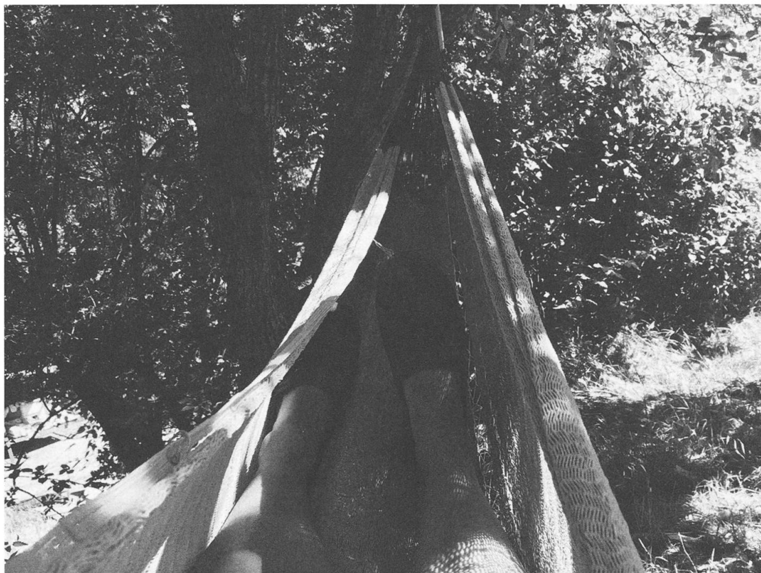
Abb. 1: In der Hängematte.

mittag später, entfaltet sich wie von selbst ein neuer Gedanke, auf den ich selber nicht gekommen wäre. Ein schaukelnder Gedanke zu neuen Lehr-Lern-Formaten. Das ist Hängematten-Wissen-schaf(f)t. 4