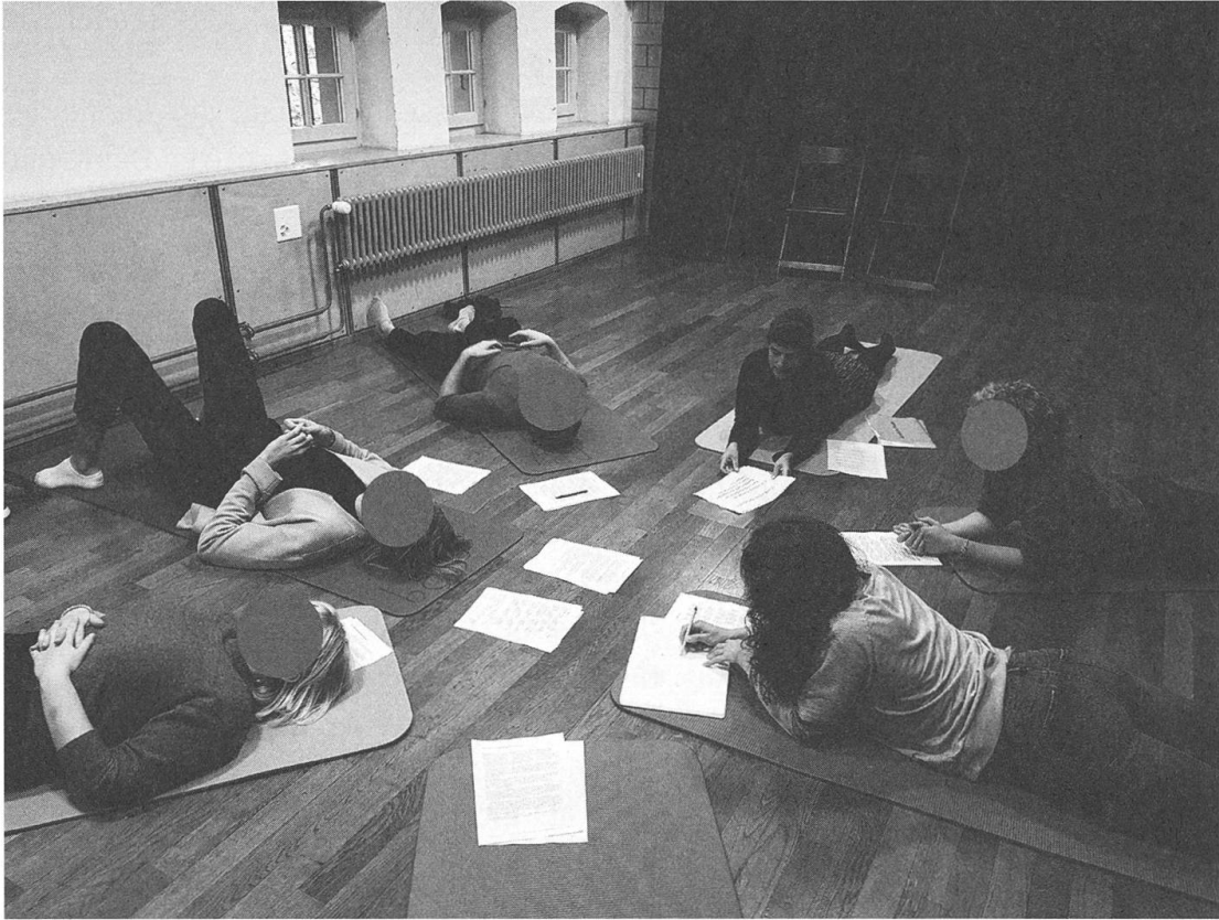
Abb. 2: Referat liegend.

ting forderte von mir also eine bestimmte (Körper-)Haltung ein – einfach eine andere.) Selbstverständlich überlegte ich danach, wie es wäre, wenn sich an der Uni oder an einem Kongress alle hinlegen würden. Wer genau gibt vor, wie Kulturwissenschaft im Alltag des Wissenschafts- und Lehrbetriebs praktiziert werden soll? Was passiert, wenn es immer wieder anders gemacht würde – mal so, mal so? 45