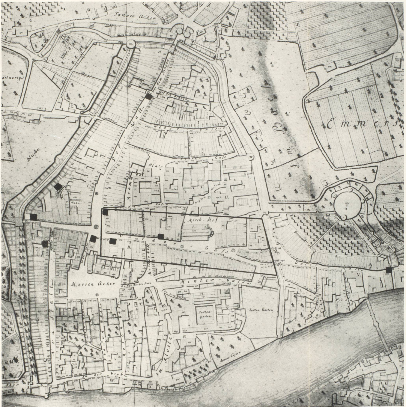
Plan von J. L. Peyer 1820 (Original im Museum)

■ Wohntürme — Grenze des ältesten Stadtkerns