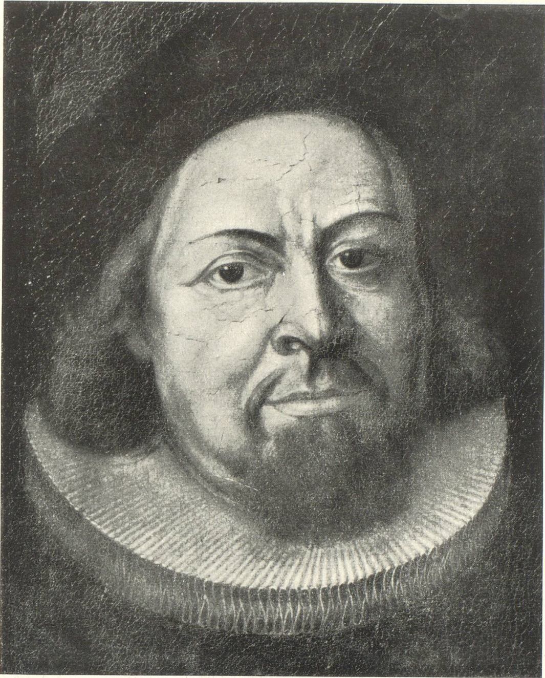
Antistes Melchior Hurter II. 1645 — 1713

Ausschnitt aus einem beschädigten Oelgemälde von Joh. Martin Veith im Museum zu Allerheiligen