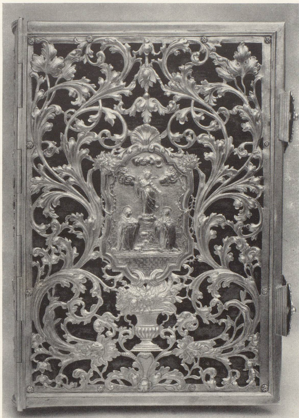
Weesen, Kloster, Meßbuch 1734 von Goldschmied Schalch, Schaffhausen (GS) (S. 18)