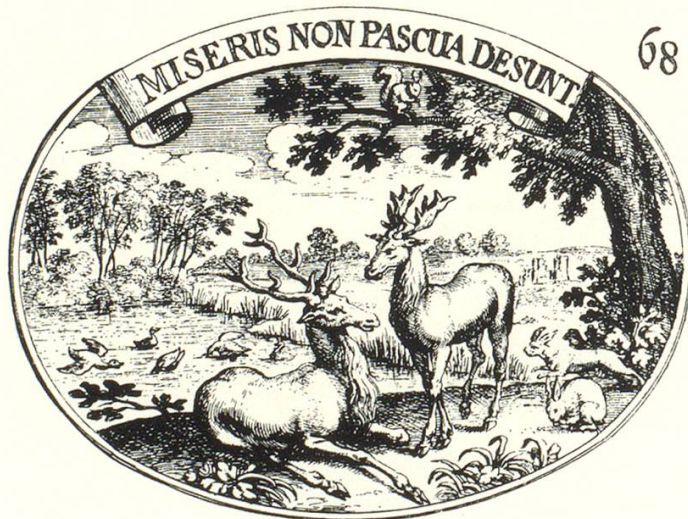
Text S. 212