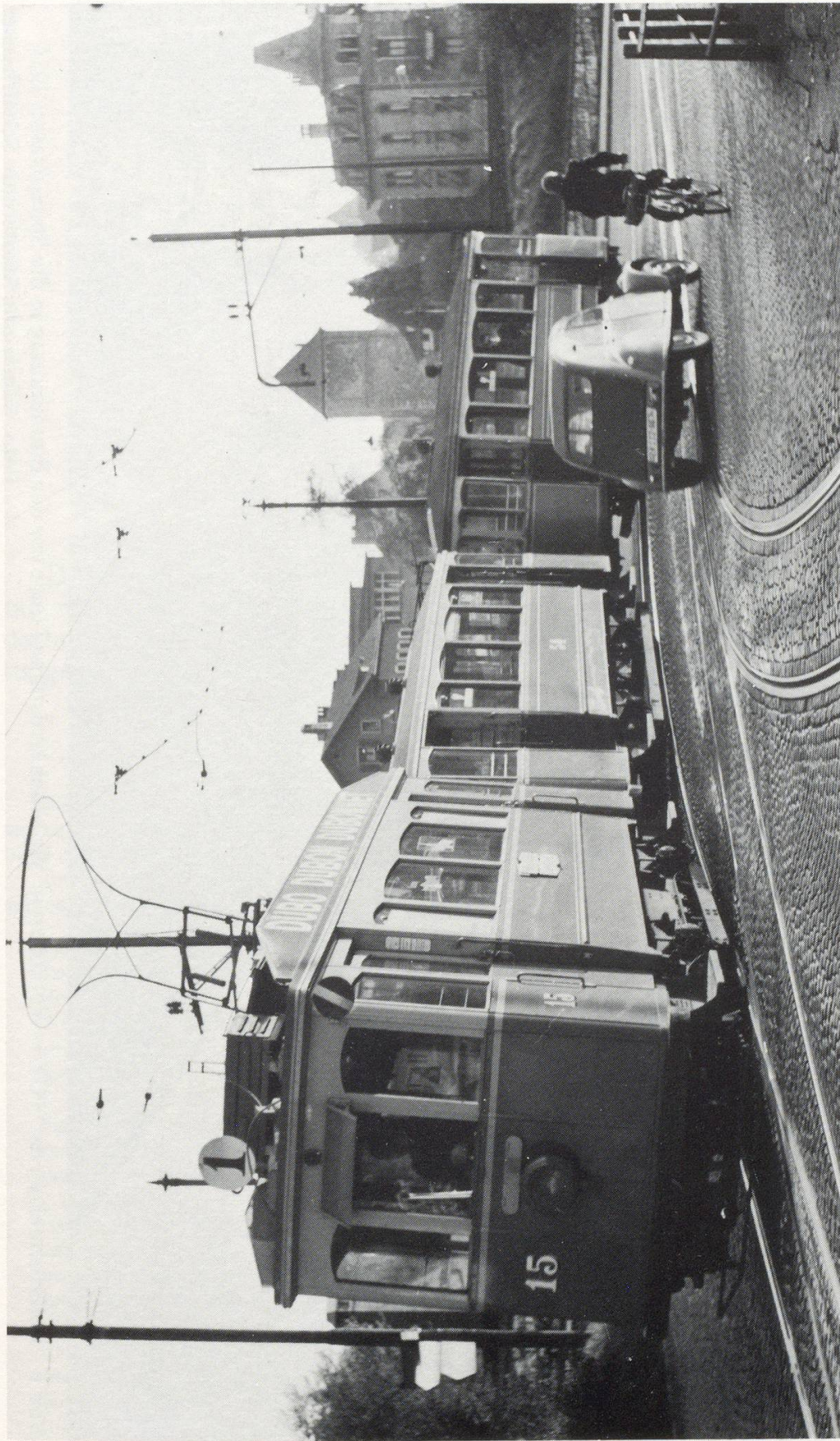
Bild 5 Tramzug der Schaffhauser Strassenbahn auf der Fahrt ins Industriequartier Ebnet im August 1963.