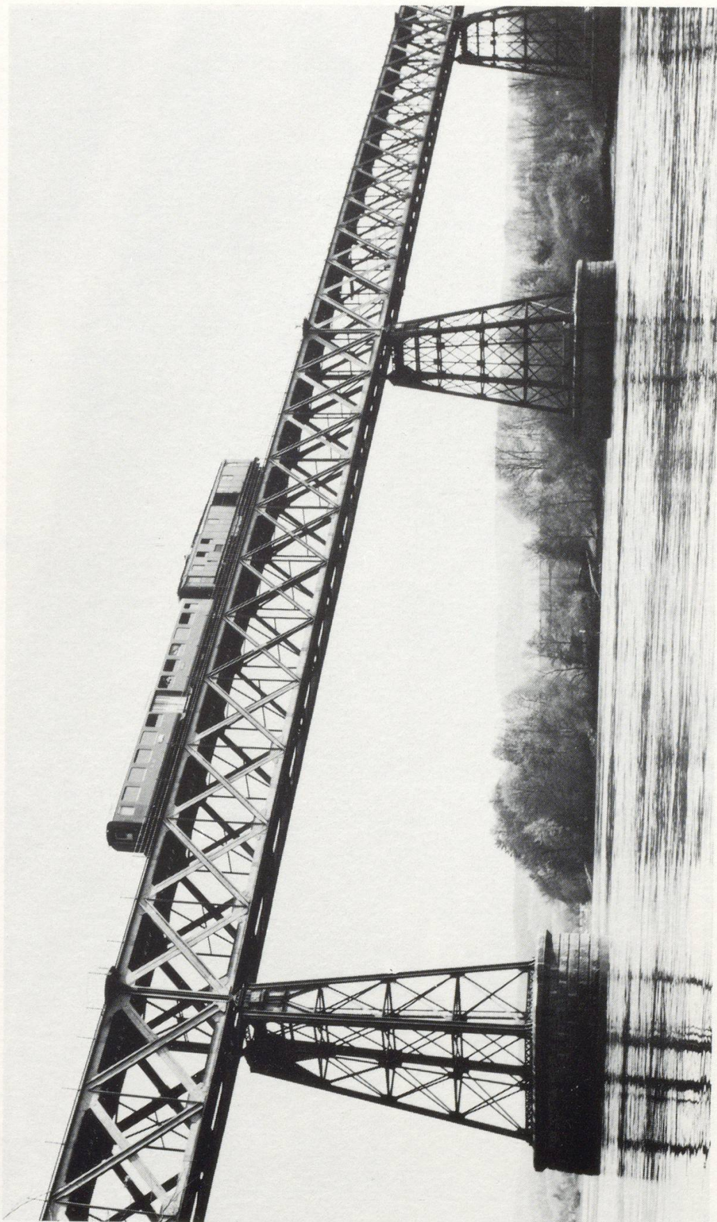
Bild 1 SBB-Linie Etzwillen-Singen. Personenzug auf der Rheinbrücke bei Hemishofen am 22. April 1968.