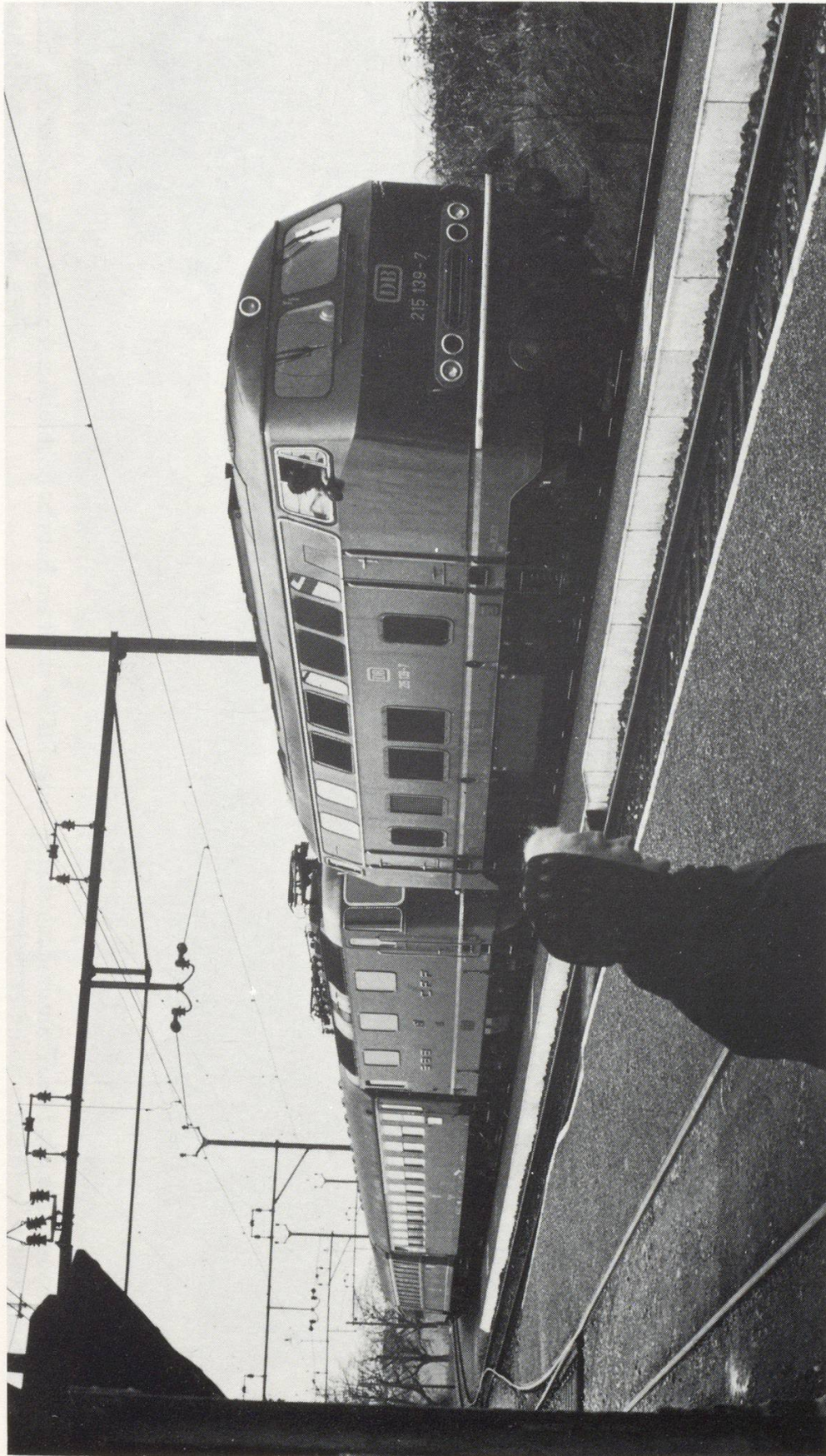
Bild 3 Ein Beispiel internationaler Zusammenarbeit im Eisenbahnverkehr: Die DB-Diesellokomotive 215 139-7 holt in Altenburg-Rheinau den wegen Stromausfalles stehengebliebenen SBB-Schnellzug 384 Zürich-Schaffhausen ab. 11. April 1973